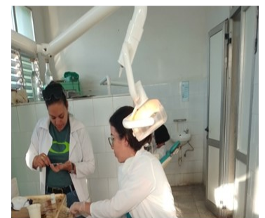
Clínica local.

Como una agravante al déficit de materiales dentales, está la prohibición de las autoridades de Salud, en la provincia, de utilizar anestesia importada, por los supuestos "peligros para la vida del paciente".