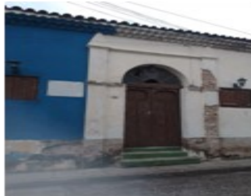
Hospital San Juan de Dios.