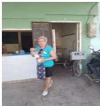
Punto de leche.

La poca disponibilidad de leche en la Empresa Láctea se convierte hoy en la causa principal que provoca el envío de este cuestionable alimento a las 583 bodegas del territorio provincial.