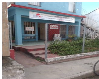
ONAT municipal.

Según Rafael Torres, cliente afectado el pasado lunes se produjeron dos reclamaciones por problemas similares.