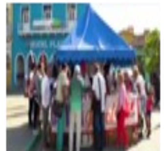
Feria del libro.

Los intentos de las autoridades locales de brindar una feria interesante, iniciada con una gala cultural en el teatro Conrado Benítez, no logró esta vez impresionar a los espirituanos, para quienes el evento dejó mucho que desear.