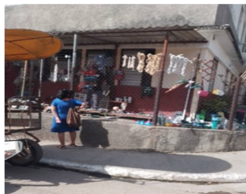
Cuentapropista local.

Como otra de las causas del abandono de esta actividad, están las continuas exigencias para justificar los productos con que trabajan.