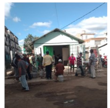
Punto de Gas.

La actual situación que se presenta en el municipio cabecera ocurre en el resto de los municipios espirituanos, principalmente con aquellos núcleos que tienen asignados el producto, por censo médico y lo reciben cada seis meses.