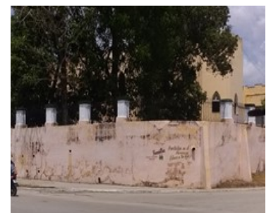
Hogar de ancianos.

principal de este lamentable hecho que puede volver a repetirse si el régimen no se toma en serio el cuidado y protección de este grupo social vulnerable.