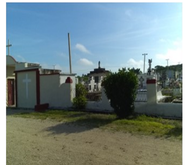
Cementerio de Guayo.

Esta situación con la falta de cementó en los cementerios se repite en la mayoría de los campos santos de la provincia, pese a tener en el territorio una de las fábricas de mayor producción del producto del país, la Siguaney, cumpliéndose aquello que reza: “en casa del herrero cuchillo de palo” .