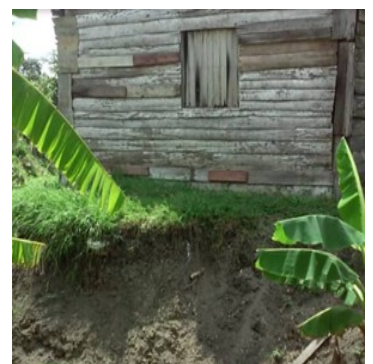
Zona del derrumbe.

Para enfrentar los efectos de los derrumbes, los vecinos en mayor peligro han comenzado a evacuar sus bienes hacia viviendas más seguras de la comunidad.