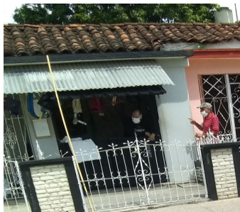
Cuenta propista local . Foto ICLEP

Como resultado de esta ofensiva policial, el área del mercado de trabajadores por cuenta propia permanece totalmente cerrada.