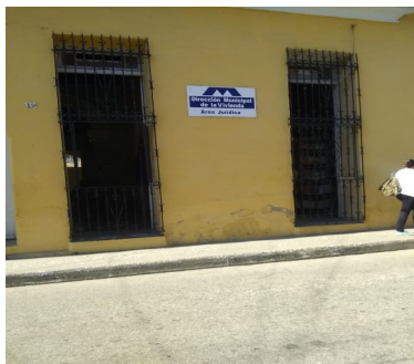
Dirección de la vivienda.