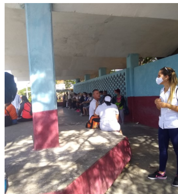
Parada local.

La situación se hace más compleja al prohibirle a funcionarios, dirigentes y choferes que transitan en carros estatales, recoger pasajeros en las paradas.