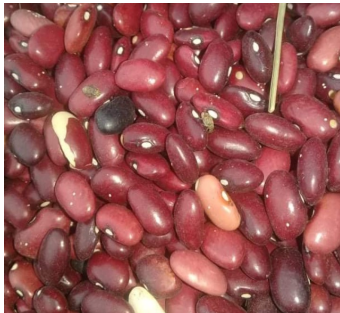
Frijoles picados .

Este hecho no es el primero de su tipo en la provincia, en otras ediciones se ha denunciado la venta a la población de cárnicos y otros productos en mal estado.