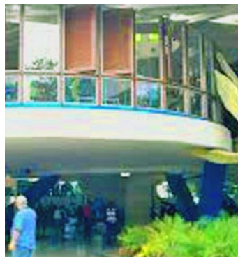
Coppelia sin cola.