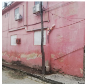
Fosa vertiendo.

En la mañana del 5 de enero trabajadores del centro de aislamiento para enfermos con La Covid-19, ad-junto al Hospital Freire Andrade, conocido por Emer-gencia, en Centro Habana, denunciaron el vertimiento de una fosa y la acumula-ción de desechos sólidos en la zona.