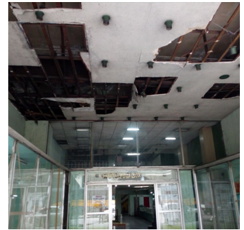
Mercado estatal.