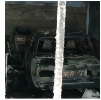
Lada quemado.