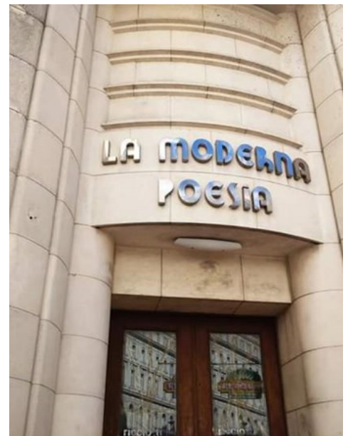
Librería La moderna poesía.

Gobierno capitalino da por perdida la emblemática librería La moderna poesía >>6