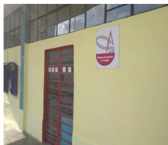
Comedor sin viejos.

Portuondo, anciano asistenciados hasta el momento, desde el primer día pocos ancianos pudieron costear el servicio. Las comidas escalaron de 2 pesos Moneda Nacional (MN) has-