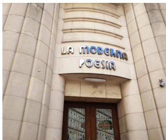
La moderna poesía.

Bernaza # 105, declaró: “Es lamentable como se destruye todo en el país. Lo que ha pasado a la librería no es más que un reflejo de la destrucción progresiva de Cuba bajo el socialismo”.