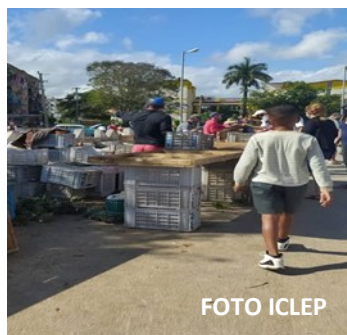
Mercado de oferta y demanda

“Ya los guajiros y los vendedores no se dejan intimidar tan fácilmente, siempre buscan la manera de burlar la vigilancia porque la cuenta no da, si esperan por Acopio se los come el león y en ocasiones pierden sus cosechas esperando por un transporte estatal que recoja las producciones. Nosotros pagamos y recogemos todo al momento, eso nadie puede cuestionarlo”, acotó.