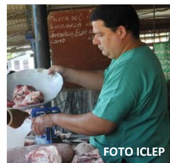
Vendedor de carne de cerdo