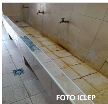
Lavaderos del politécnico

También mencionó, que unos quince estudiantes han enfermado con gripe en lo que va de mes por bañarse en los lavaderos del centro prácticamente a la intemperie.