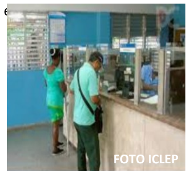
Correo La Rotonda