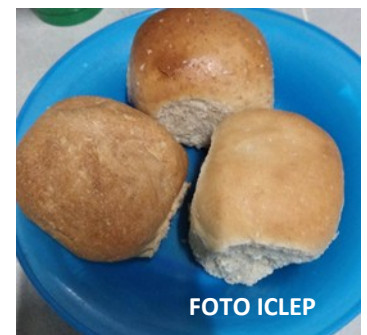
Pan de la cuota