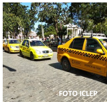
Taxis de turismo vacíos