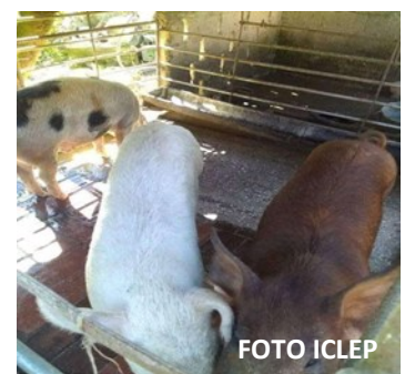
Corrales de cerdos