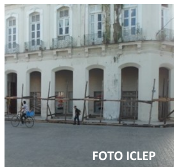
Marquesina Maruyama