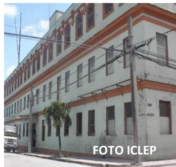
Fábrica de cigarrillos