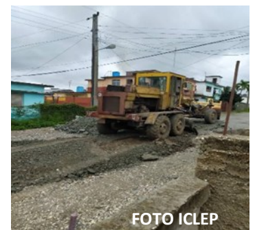
Brigada No 4 trabajando

“No puedo dejar solo al equipo por temor a que lo roben y no hay petróleo para regresar, una locura y tremendo abuso”, significó el obrero.