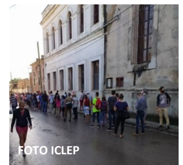
Estudiantes en cola

“Los jefes nos dijeron que no hay combustible, que solo se darán dos viajes en la mañana y dos en la tarde por cada carro. Son muchos los muchachos que llegan aquí de madrugada y se ven obligados a regresar a sus casas porque no hay guaguas. Lo más duro es que la mayoría de las escuelas están a muchos kilómetros y no existen otras alternativas para viajar a esos lugares. Ya ni en sus bicicletas pueden ir”, advirtió la fuente.