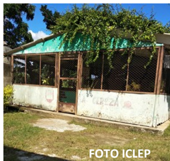
Placita en Santa Clara