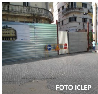
Calle Cuba cerrada