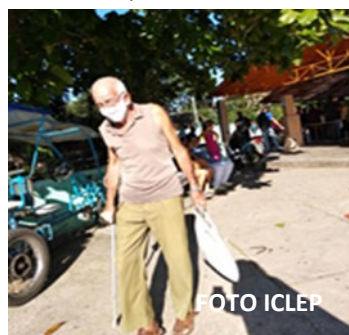
Anciano realizando mandados

Ahora que es el momento de establecer las medidas pertinentes y proteger a los más vulnerables, el gobierno continúa con las manos cruzadas ignorando el peligro a que se enfrentan estas personas. Ojalá que no sea muy tarde y reciban lo que necesitan.