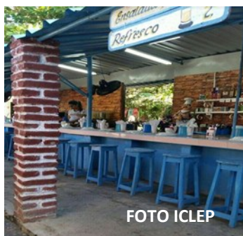
Restaurant en La Candonga

Estos problemas establecen un sinnúmero de irregularidades sociales, pero, no cabe dudas, que La Candonga, a lo largo de los últimos años, ha constituido un salvamento real para muchas familias. Para otros solo una vidriera inalcanzable.