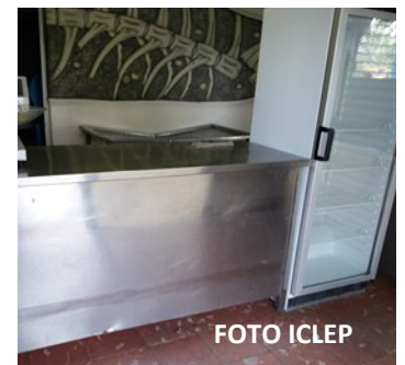
Mercado La naranja

“Todo lo que estamos pasando ha afectado aún más el estado de ánimo y las posibilidades económicas de un colectivo integrado por treinta tres personas.”, puntualizó Gómez. Al respecto Sonia Acalle, funcionaria de la Empresa de Comercio informó, que esas entidades no reciben productos porque las asignaciones que antes se otorgan están suspendidas por el nivel central debido a la crisis económica que vive el país.