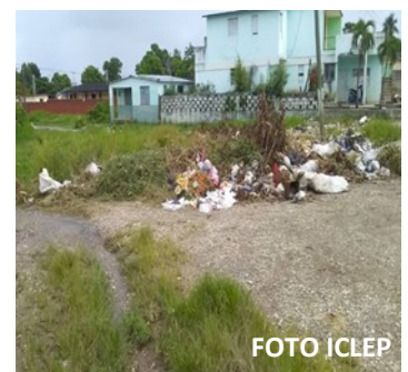
Basurero en Los Paraguitas