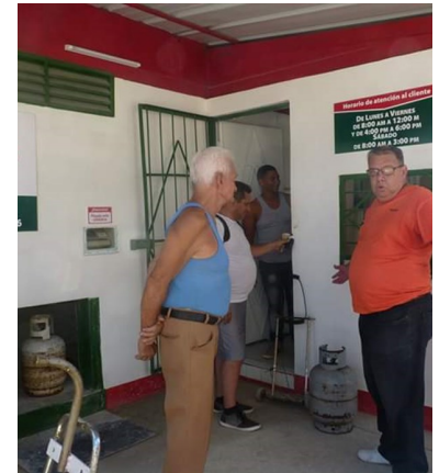
Los clientes denuncian que los puntos de venta no quieren entregar los cilindros de la reserva.

Reportes en otros puntos de la ciudad dan cuenta de que el precio de los cilindros ronda los 20 CUC.