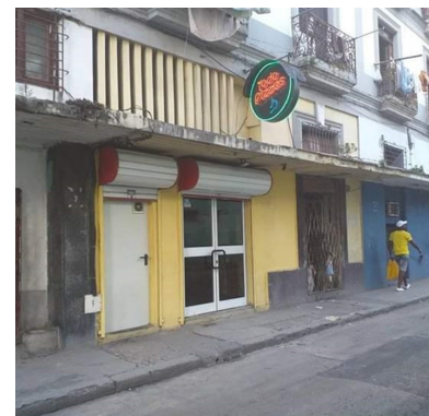
Las limitaciones a los negocios privados afectan a miles de personas en la ciudad (Foto ICLEP).

“Si es por una cuestión de higiene, es contradictorio porque las estatales tienen menos y encima no ofertan nada”, resaltó Varona.