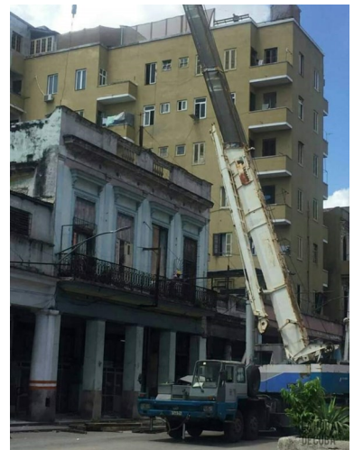
Los derrumbes obligan a cientos de personas a vivir albergados, por tiempo indefinido.

“No hay nada más parecido al lejano oeste que un albergue de estos”, describía Marlén Cubillas, habitante del albergue de la calle san Gregorio.