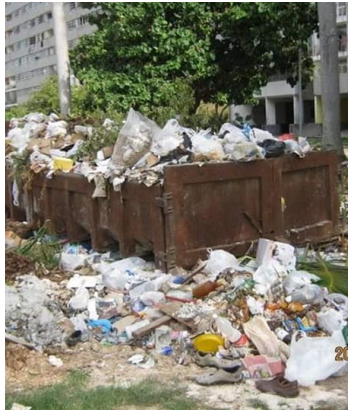
En plena cuarentena aumentan los basureros en la ciudad.

“Se calcula que tenemos más de 20 micro vertederos y cientos de basureros en el municipio”, dijo Álvarez.