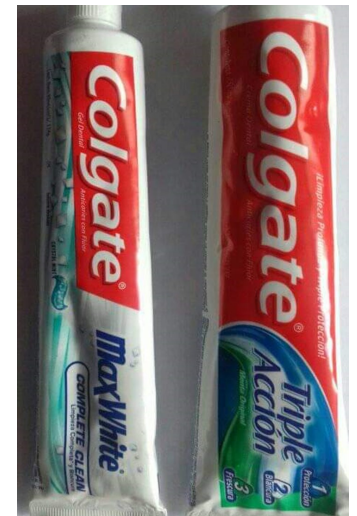
En el mercado negro es donde único se puede encontrar pasta de dientes, por más de 10 CUC.

“Habían dicho que la iban a mandar por la libreta, de nuevo, pero hasta el sol de hoy nada. Cuando aparece un tubo por la calle, vale 100 pesos, de ocho que cuesta por el estado”, señaló Aida Abreu en el Cerro.