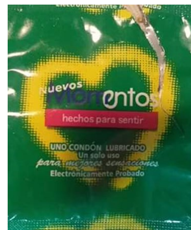
Los preservativos no escapan a la escasez existente en la ciudad.

Ocasionalmente, los jóvenes logran encontrar condones en las ventas clandestinas, donde el precio por unidad se elevó a un CUC.