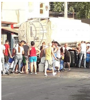
La distribución de agua en pipas, sin la calidad requerida, habría originado el brote.