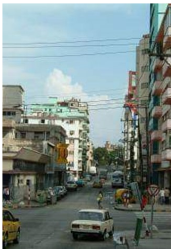
El reordenamiento urbanístico será una de las acciones a tomar por el IPF.