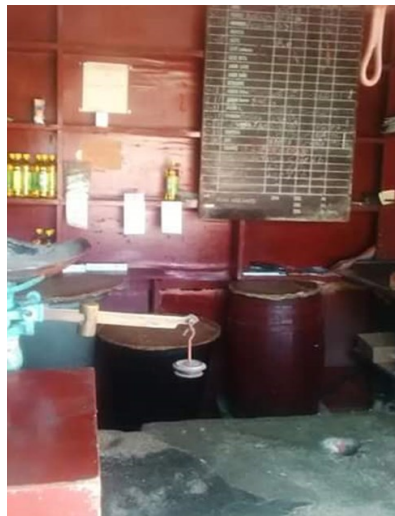
La venta liberada de arroz se encuentra detenida, con las bodegas desabastecidas.

“Pero es que ni eso se puede comprar, porque además de que no hay casi nunca, cuando aparecen también están súper caras y para poder comprar para que toda la familia coma sale más caro que par de libras de arroz. El gasto es diario, insoportable”, comentó Eliécer Góngora, de Arroyo Naranjo.