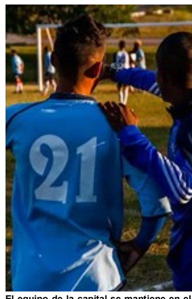
El equipo de la capital se mantiene en el pelotón de avanzada del Torneo de Clausura.

“Los peros que han puesto son incontables, lo más estúpido fue que no podían garantizar la seguridad del grupo fuera de La Habana y que muchas veces los juegos terminaban en bronca”, dijo Robaina.