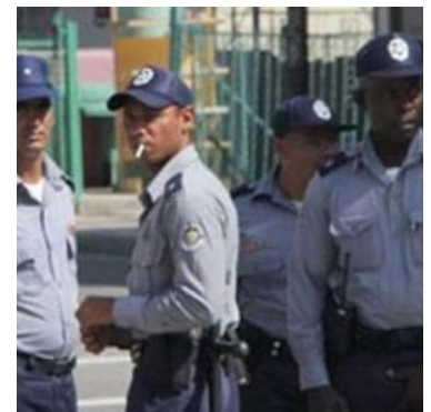
La persecución policial no se detiene.

Según este funcionario, “en el futuro inmediato no se vislumbra un cambio en favor de la gestión económica privada por temor a que las cosas se salgan de control y no puedan contener a las personas pero ese momento tiene que llegar y llegará por su propio peso”, y tras una pausa sentenció: “ahora es peor, existen miles que venden ropa a la sombra y eso, es indetenible”.