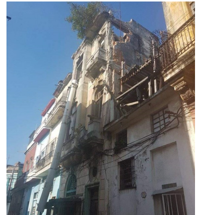
Casi todas las calle de La Habana Vieja tienen un edificio a punto de caerse.

“Siempre es un cuento diferente, o bien porque no hay petróleo, o porque no hay camiones o porque Comunales no puede recoger los escombros”, expuso Fernández.