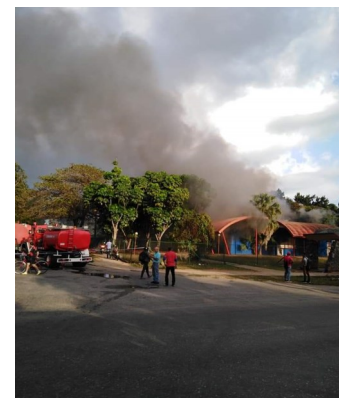
Las autoridades sospechan que el incendio fue provocado de manera voluntaria.

“Están convencidos que la candela fue a propósito, dicen que si no cooperamos podemos ir presos”, expresó la fuente anónima.