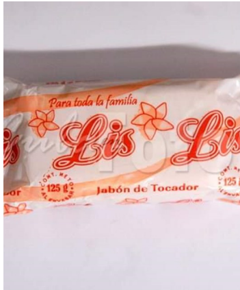
El jabón vuelve a la lista de productos normados por la libreta de abastecimiento.

“Para solucionar un problema crean otro”, dijo Yamilé Perdomo, una de los 1275 consumidores de la bodega de Montenegro. “Dos jabones no alcanzan para nada”.