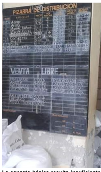
La canasta básica resulta insuficiente para alimentar a las familias.