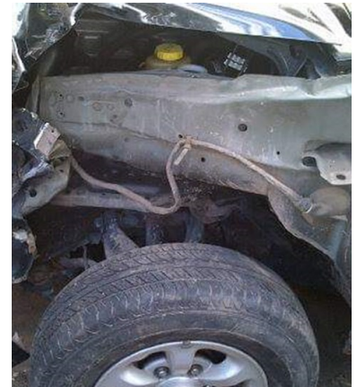
El Peugeot quedó destrozado en el impacto del accidente.