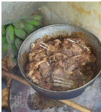
Cocinar con madera es la opción de muchos habaneros.