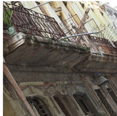
Los balcones en peligro de derrumbe son una amenaza para quienes necesitan caminar por las aceras.

“Imagínate tener que arreglar las aceras, las que se puedan arreglar porque la inmensa mayoría hay que hacerlas nuevas. La mitad de los edificios tienen daños en las estructuras eléctricas y en muchos de ellos toda la cabling está tirada por las aceras”, agregó.