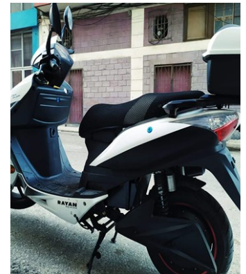
Las motorinas desaparecieron de las tiendas en Moneda Libremente Convertible.

“Lo que no se explica es que las personas en Revolico las tengan vendiendo, y que el estado, que es más poderoso, no tenga para vender”, comentó Oliva.