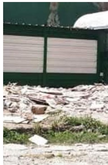
La falta de seguridad es la causa de los robos. Muchos contenedores han cerrado definitivamente.

“El problema es que somos un blanco fácil”, dijo.