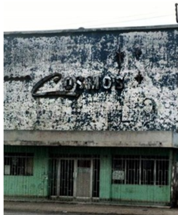
Cerrado hace más de una década, el cine Cosmos está entre los locales solicitados al gobierno.

“Eso es lo que le gusta a este gobierno, que el pueblo pase trabajo”, destacó Bruzón quien, asegura, en cualquier momento ocupa de manera ilegal uno de estos.