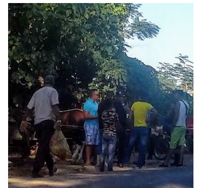
Los caballiteros comienzan a llegar a la capital, para cumplir con su peregrinaje anual.