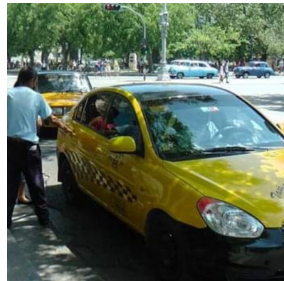
Los balcones en peligro de derrumbe son una amenaza para quienes necesitan caminar por las aceras.

“No sobra casi nada y encima ponle los salarios, tiene que haber un déficit”, dijo Roque, quien aseguró que las cooperativas planean vender los autos no utilizados a empresas estatales del interior del país.