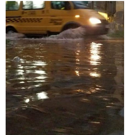
Tupiciones en el sistema de alcantarillado provocaron que las calles se inundaran.

“Pero es el que tiene dinero, los que no tienen que aguantar el agua invadiendo la casa”, dijo Duvergel.