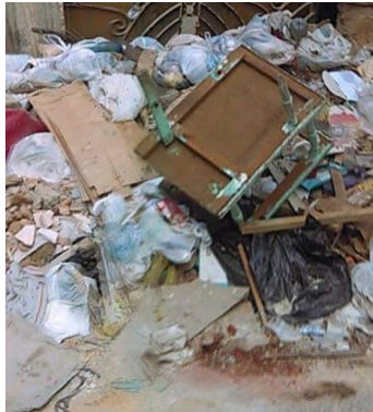
La basura ocupa aceras y calles de la ciudad.

Fuentes recordó que cada cierto tiempo brota alguna epidemia por causa de la suciedad a la que están expuestos los habaneros.