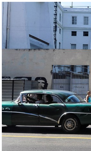
Atentos a los rumores, los boteros amenazan con entregar las licencias (Foto ICLEP).

Recuerda Borges que los boteros para burlar las medidas establecen sus propios tramos sin que las autoridades hagan nada al respecto.