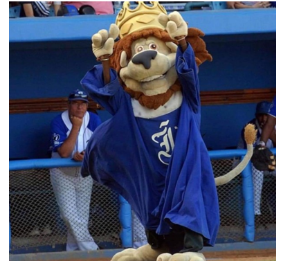
Las semifinales depararon la eliminación de los leones capitalinos.