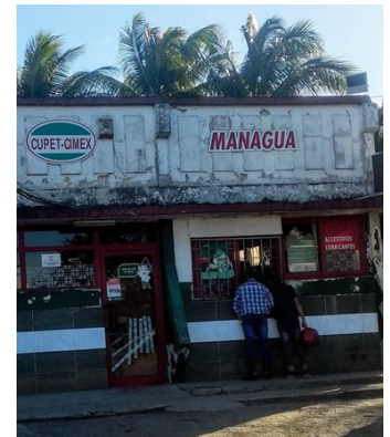
El Cupet de Managua sufrió su sexto asalto.

“Lo peor es que roban y roban y nunca cogen a nadie. Y eso que la policía queda a 200 metros”, señaló Misleydis.