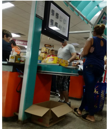
La alta demanda de fin de año terminó generando desabasto en el mercado de 3ra y 70.

“A veces uno viene aquí porque es de los pocos lugares donde siempre hay de todo, pero parece que la debacle llegó a todas partes. En fin de año esto era una fiesta, había de todo y por cantidades”, comentó Águila, quien criticó que los estantes vacíos fueron llenados con pomos de agua.