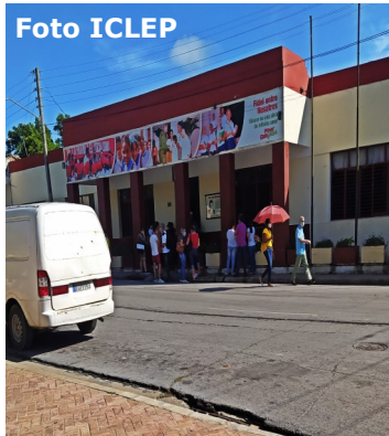
Escuela Tomás Orlando.

La Ministra de Educación declaró en la Mesa Redonda que las condiciones estaban creadas y muy bien planificadas para reiniciar el curso escolar 2019-2020.