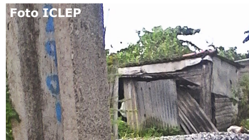
Casa de los hermanos Padilla.

Cientos de ex-militares retirados y trabajadores civiles del MININT pierden toda ayuda de la institución al momento de su jubilación como estos hermanos.