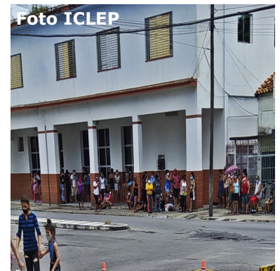
Cola para comprar por tarjeta.

Otra prueba fehaciente del total fracaso de las tarjetas es que en varias comunidades rurales de la cabecera pinareña aún no han vendido ningún tipo de producto, situación que hace sentir a los vecinos como excluidos.