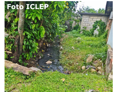
Zanja de desagüe.

Las familias afectadas responsabilizan al gobierno pinareño por su falta de respuesta a las quejas presentadas hace menos de un mes por los pobladores.