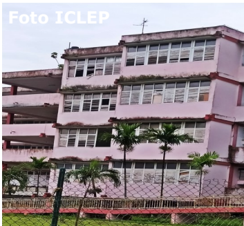
Percionales en mal estado.

Varias reclamaciones han sido hechas desde la dirección de la escuela al Gobierno Provincial para contratar una brigada y resolver percionales de aluminio que son más duraderos, pero siempre las respuestas dadas son que no hay materiales.