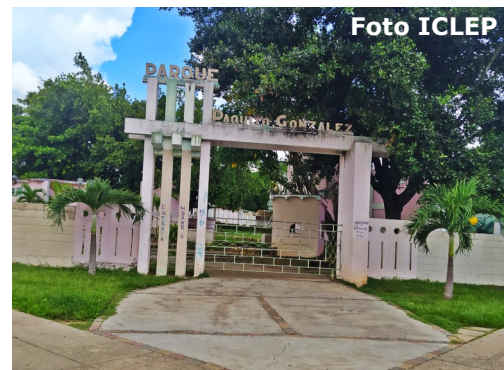
Patrulla frente a la casa del acusado.

Los padres del municipio sienten que han perdido el lugar preferido de sus hijos donde por más de 4 generaciones los niños pinareños se han reunido para disfrutar de una diversión en familia.