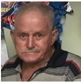
Por: Aníbal Blanco Cubano de a pie

El cambio climático se define como la variación en el estado del sistema climático terrestre, formado por la atmosfera, la hidrosfera, la biosfera entre otros, que perdura durante periodos de tiempo suficientemente largos hasta alcanzar un nuevo equilibrio. Es la variación global del clima de la tierra. Esta variación se debe a causas naturales y a la acción del hombre y se produce sobre todos los parámetros climáticos, temperatura, precipitaciones, nubosidad, etc, a muy diversas escalas de tiempo.