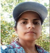
Por: Yelenis Jaimes Cubana de a pie

Pinar del Río, (ICLEP). Reclamaron varios vecinos de la comunidad El Marañón ante la oficina de atención a la población del partido municipal este 20 de julio por haberles negado el arreglo al camino de acceso.