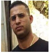
Por: Carlos Agudelo Cubano de a pie

Es bien conocido el popular dicho de que “La avaricia rompe el saco”, pero actualmente el régimen en un intento desesperado por recoger divisas como el Dólar o el Euro hace de todo para adquirirlas sin importar lo que cueste o a cuantas personas tengan que pisotear para lograr el objetivo de ingresarlas a sus cuentas.