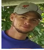
Por: Luis M. Cala Cubano de a pie

Pinar del Río, (ICLEP). Ante la reducción de transporte público impuesta por el régimen en la ciudad pinareña los cocheros asumen el traslado de pasajeros hasta los kilómetros 4 de cada carretera y algunos puntos de la ciudad.