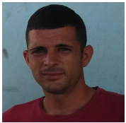
Por: José L. Ruíz Cubano de a pie

Pinar del Río, (ICLEP). A raíz de un mal trabajo realizado por la brigada de caminos de la empresa de desmonte y construcción el acceso al poblado del Cuajaní de la ciudad pinareña quedó intransitable debido a las intensas lluvias y en espera de una solución.