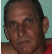
Por: Pedro Santos Cubano de a pie

Pinar del Río, (ICLEP). Accidente ocurrido este 17 de julio en el reparto Hermanos Cruz entre un carro de caballo y una moto dejó como consecuencia dos heridos leves.