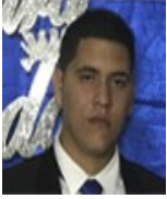
Por: Ariel Zambrana Cubano de a pie

Pinar del Río, (ICLEP). Los pobladores pinareños han mostrado una gran insatisfacción respecto a las nuevas tiendas en Dólar americano por los elevados precios y la desigualdad respecto a los demás puntos de venta de la ciudad.