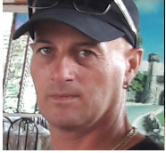
Por: Daniel Tamayo Cubano de a pie

Pinar del Río, (ICLEP). Al grito de “hasta cuando hay que esperar”, varios vecinos del reparto Oriente se reunieron frente al punto de venta ubicado en la calzada de la Coloma y la calle I este martes 21 de julio.