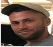
Por: Manuel Cala Cubano de a pie

Pinar del Río, (ICLEP). En 1994 surgía una banda que se convertiría en uno de los íconos del rock en Cuba. Portadora de una sonoridad peculiar que incluye ritmos afrocubanos y caribeños, Tendencia sigue, 25 años después, en la preferencia del público que ama el género.