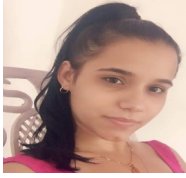
Por: Shely Muñoz Cubana de a pie

Pinar del Río, (ICLEP). La falta de productos químicos para el control de plagas y enfermedades dio lugar a que los floricultores del organopónico El Vial en la provincia pinareña perdieran la cosecha de girasol.