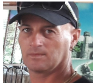
Por: Daniel Tamayo Cubano de a pie

Pinar del Río, (ICLEP). Los clientes del centro Las Trillizas en el Reparto Calero se reunieron en las afueras del lugar para protestar en contra de los elevados precios de los módulos vendidos con artículos de primera necesidad.