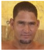
Por: Isidro Salas Cubana de a pie

E l estrés es un sentimiento de tensión física o emocional. Puede provenir de cualquier situación o pensamiento que lo haga sentir frustrado, furioso o nervioso. Es el mecanismo que se pone en marcha cuando una persona se ve envuelta por un exceso de situaciones que superan sus recursos. Por lo tanto, se ven superados para tratar de cumplir con las demandas que se le exigen para superarlas. En estos casos, el individuo experimenta una sobrecarga que puede influir en el bienestar tanto físico como psicológico y personal.