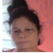
Por: Alicia Camacho Cubana de a pie

Pinar del Río, (ICLEP). Fuertes lluvias en la segunda mitad de junio han afectado con derrumbes en las laderas y huecos profundos en los caminos a la pista local de Motocross.