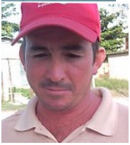
Por: Abelardo Ibarra Cubano de a pie

Pinar del Río, (ICLEP). La falta de recursos de las brigadas de trabajo de comunales para embellecer la fachada de los edificios del reparto Hermanos Cruz muestra al público la pésima imagen de este reparto tan prestigioso.