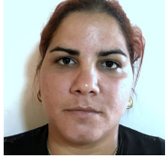
Por: Onelsys Díaz Cubana de a pie

Pinar del Río, (ICLEP). La imagen tomada el día 17 de junio de 2020 muestra un anciano vagando en las calles pinareñas al no tener un hogar para vivir porque el gobierno cubano no le ha dado amparo.