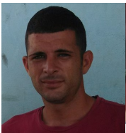
Por: José L. Ruíz Cubano de a pie

Pinar del Río, (ICLEP). Varios años de abandono en cuanto a mantenimiento trajeron como consecuencia que la pista de moto del complejo deportivo pinareño presente un alto nivel de deterioro quedando intransitable.