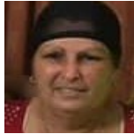
Por: Adelaida Díaz Cubana de a pie

Muchas han sido las medidas tomadas por el estado para ayudar al pueblo a recibir equitativamente los productos de primera necesidad y a la vez evitar la propagación del coronavirus. Cada día queda demostrado que la mayoría de estas no han cumplido su objetivo creando inconformidad en el pueblo. Muchos son los atropellos q han vivido las personas gracias a estas medidas a pesar de estar luchando por recibir algún producto, aun recordando sus derechos como consumidor.