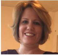
Por: Maurín González Cubana de a pie

Pinar del Río, (ICLEP). Dieciséis viviendas y cuartos de azotea de la calle principal de Pinar del Río se encuentran actualmente en mal estado representando un peligro potencial de derrumbe y poniendo en peligro la vida de sus habitantes.