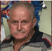
Por: Aníbal Blanco Cubano de a pie

Pinar del Río, (ICLEP). En aras de ayudar al pueblo a disminuir las carencias de agua los choferes de Acueducto encargados de las pipas principalmente se decidieron a prestar servicio en las zonas más necesitadas de la provincia pinareña pero ello terminaron sancionados.