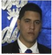
Por: Ariel Zambrana Cubano de a pie

En estos días cuando más conciencia se debe tener con el pueblo por la horrible situación que estamos atravesando a causa de la COVID-19, las necesidades y carencias sobresalen por encima de las oportunidades y nos damos cuenta que hay desigualdad, preferencias y que el pueblo pinareño no recibe todo el apoyo necesario por parte del estado en este tiempo donde las personas viven estresadas y muy preocupadas por todo lo que ocurre en el día a día.