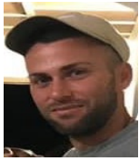
Por: Manuel Cala Cubano de a pie

Pinar del Río, (ICLEP). Siete pinareños integran la lista de jóvenes talentos confeccionada por la dirección nacional de béisbol para recibir entrenamiento diferenciado en el periodo 2020 al 2024.