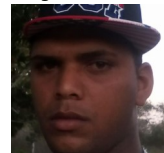
Por: Adonis Lago Cubano de a pie

Pinar del Río, (ICLEP). Deshabilitadas dos cajas registradoras en el mercado La Mía del municipio pinareño por decisión del gerente afecta la fluidez de las ventas y a la comodidad de la población.