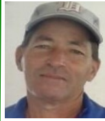
Por: Alfredo Paredes Cubano de a pie

Pinar del Río, (ICLEP). Precios elevados de los alimentos en conserva impide la compra de estos a los pobladores pinareños en los mercados en divisas de la ciudad.