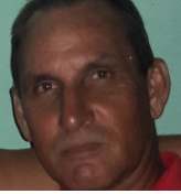
Por: Pedro Santos Cubano de a pie

Pinar del Río, (ICLEP). Atelier pinareña ya no será partidaria de la producción de nasobucos para los centros más necesitados en estos tiempos de pandemia al ser encontradas por inspectores de salud pública muestras positivas del mosquito Aedes aegypti en reservas de agua, por lo que se determinó el cierre del centro.