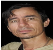
Por: Ariel Padilla Cubano de a pie

Pinar del Río, (ICLEP). Debido a que el gobierno cubano no se ha preocupado por brindar los materiales necesarios para arreglar los viveros de frutales afectados por una tormenta local severa en la Finca El Álamo en la Carretera a la Coloma los pobladores de esta zona no recibirán este año las frutas que se cosechan en la finca.