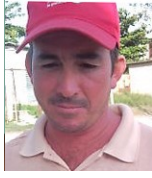
Por: Abelardo Ibarra Cubano de a pie

Pinar del Río, (ICLEP). Crisis alimenticia en repartos de la capital pinareña en las últimas semanas de mayo desespera a vecinos escasos de recursos al verse sin nada para comer en sus casas.