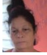
Por: Alicia Camacho Cubana de a pie

Pinar del Río, (ICLEP). Más de 1400 habitantes en el reparto 5 de septiembre en la provincia de Pinar del Río presentan afectaciones con el suministro de agua potable debido a los salideros constantes de las envejecidas redes de acueducto.