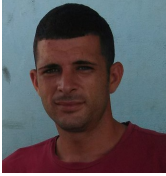
Por: José L. Ruiz Cubano de a pie

Pinar del Río, (ICLEP). El 18 de mayo producto a las intensas lluvias ocurridas en la capital pinareña y el sistema de alcantarillado defectuoso 3 calles se inundaron interrumpiendo la circulación de peatones y vehículos por más de 12 horas.