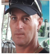
Por: Daniel Tamayo Cubano de a pie

E l Ministerio de la Industria Alimentaria (MINAL) aseguró buscar variantes e incrementar la eficiencia para aumentar la producción y entrega de alimentos para nuestro pueblo. Una de ellas fue comenzar la venta de carne de cerdo en los diferentes centros agropecuarios del país.