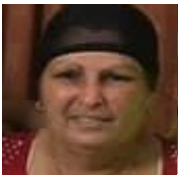
Por: Adelaida Díaz Cubano de a pie

Pinar del Río, (ICLEP). El mercado El Fuego hace dos semanas muestra al público los exhibidores refrigerados sin líquidos debido a la falta de preocupación del estado por abastecer el lugar aun contando la provincia con la fábrica de embotellado de agua y refresco Los Portales S.A.