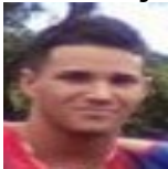
Por: Manuel Corrales Cubana de a pie

Pinar del Río, (ICLEP). La falta de materiales de construcción en la provincia tiene más de 285 construcciones de familias paradas mientras en el mes de mayo han sido terminadas en su totalidad 20 viviendas para dirigentes en la cabecera provincial.