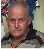
Por: Aníbal Blanco Cubano de a pie

Pinar del Río, (ICLEP). En horas de la mañana del día 17 de mayo se reunieron más de 200 personas en la carnicería La Deseada en el Reparto 10 de Octubre en espera de la segunda venta normada de pollo.