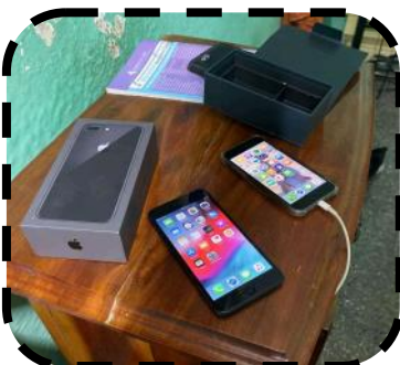
iPhone 8 Plus de 64 GB