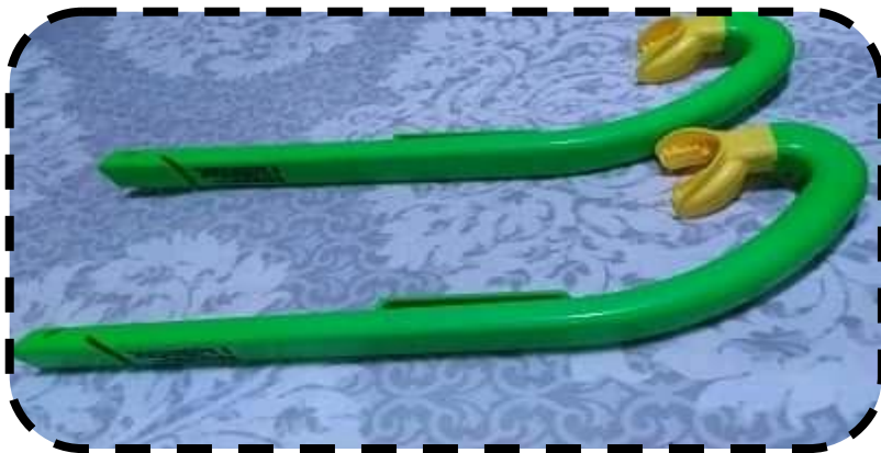
Snókers con boquilla de silicona, interesados llamar al 53713454.

Nuestro proyecto va dirigido especialmente a todos aquellos ciudadanos que quieran de una manera abierta practicar el periodismo ciudadano. Por esa razón esperamos con gran agrado la participación de todos aquellos interesados por-que creemos firmemente que todos juntos podemos hacer un mejor trabajo para el bien de todos los ciudadanos.