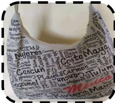
Bolsos y carteritas.