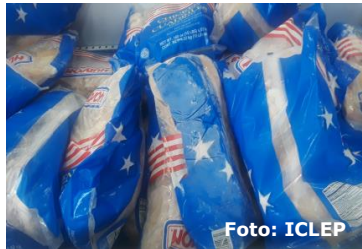
Paquetes de pollo procedentes de EEUU en tiendas estatales en Cuba.

Es evidente que el país se encuentra en medio de una fuerte crisis económica ,pero es el bloqueo interno y no el externo el culpable de la situación ,pues es el gobierno cubano y no el americano es el que fija los precios de los productos que vende en sus tiendas .