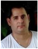
Por: Reinier Pontigo Cubano de a pie