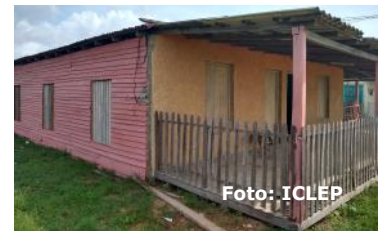
Casa con el metro contador retirado lista para demoler