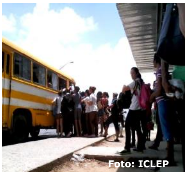
Parada de ómnibus dentro de la ciudad.

Sin embargo, todo parece indicar que la situación va a persistir ya que el suministro de petróleo a la empresa de transporte no se ha solucionado. "hasta el momento la entrada de petróleo a la empresa es el problema principal, aunque las constante roturas y la falta de piezas de repuesto también es un factor a considerar, pero nos hace más daño la falta de combustible que se está priorizando para los viajes en horarios donde hay más personal circulando en la calle, generalmente en horas de la mañana y después de las cuatro de la tarde" aseguró un trabajador de la base de transporte que prefirió no ser identificado.