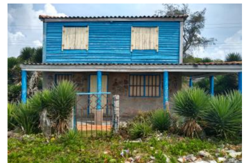
Casa en la playa de Boca de Galafre

Si todavía existen en la provincia directivos honestos, no dejen que Boca de Galafre se convierta en otro Realengo 18.