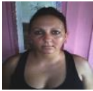
Por: Yudeisy García Cubana de a pie