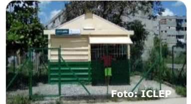
Kiosco ubicado en el reparto Hermanoz Cruz.

"No sé para que existen los quioscos de la TRD, si no tienen productos que ofertar. El pueblo se está muriendo de hambre y los quioscos continúan sin ofertas. Cada día