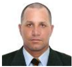
Por: Rolando Pupo Periodista ciudadano