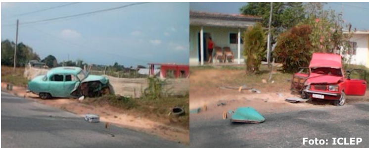
Momento del accidente.

Los accidentes del transito continúan en aumento y las causas principales están muy lejos de ser erradicadas. Entre ellas el desperfecto técnico de los vehículos en circulación que tienen mas de 50 años de explotación, además del deterioro evidente en que se encuentran las principales vías de la provincia.