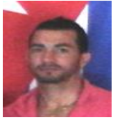
Por: Isley Ventos Cubano de a pie