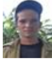
Por: Pablo Ramírez Cubano de a pie

Es importante que las autoridades de la Empresa de Viales continúen con esta labor en todas las vías existentes en la provincia y en los municipios.