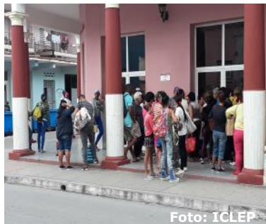
Carnicería ubicada en la Calle Yagrumas ciudad cabecera.

Por lo pronto las personas en su lucha por sobrevivir en un país donde la escases ha sido habitual, continúan esperando que del cielo llueva "Mana" como dice la profecía.