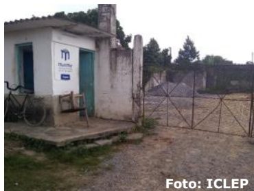
Sin suficientes recursos el punto de venta de materiales para la construcción.

Pinar del Río es una de las provincias donde más problemas existen con la construcción de viviendas. Las autoridades gubernamentales deben tomar cartas en el asunto y darle soluciones viables a este problema que afecta a gran parte de la población pinareña.