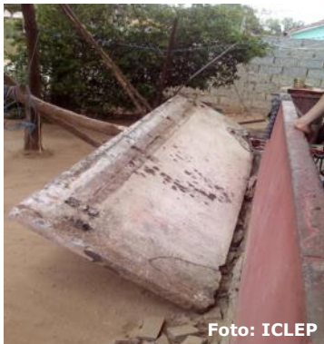
Balcón desprendido de la cuarta planta en un edificio en San Juan y Martínez.

Pinar del Río, (ICLEP). El deterioro evidente que presentan los edificios ubicados en el Hoyo de Monterrey, ha causado gran preocupación en sus habitantes, después que vieron desplomarse una pared de uno de los balcones de la cuarta planta.