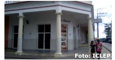
Establecimiento La Estocada.

Pinar del Río, (ICLEP). El establecimiento La Estocada, ubicado en esquina Antonio Rubio y 1 ro de Mayo, en la ciudad cabecera, fue motivo de varias publicaciones en nuestro medio comunicativo, un establecimiento que llevaba más de cinco años en derrumbe total, afectando a más de 3000 clientes y pueblo en general además del ornato y embellecimiento del céntrico lugar.