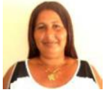
Por: Arelis Rodríguez Periodista ciudadana