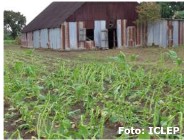
Cosecha tabacalera recién cocluida, en la zona pinareña.

facilitan el abono y los demás instrumentos de trabajo que necesitamos para que las cosechas prosperen como debe ser".