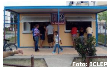
Punto de Venta perteneciente a en la ciudad cabecera, Pinar del Río.

Gran insatisfacción por parte de la población vuelta bajera con las Tiendas Recaudadoras de Divisas (TRD) en la provincia. Establecimientos que siempre tuvieron bolsas para empacar los productos adquiridos por la población. Así se les facilitaba a los compradores un mejor servicio a la hora de trasladar los productos. Desde hace algún tiempo, esto se ha convertido en algo común, el cubano de a pie tiene que sufrir las consecuencias de esta problemática, mientras