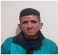
Por: Yoel López Cubano de a pie