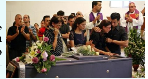
Funeral del líder del Movimiento Cristiano Liberación Oswaldo Payá

Un día como hoy, en el año 2012, murió en extrañas circunstancias en Cuba (accidente de tráfico), Oswaldo Payá Sardiñas, Premio Andrei Sájarov a los Derechos Humanos del Parlamento Europeo en 2002, y fundador del Movimiento Cristiano Liberación.