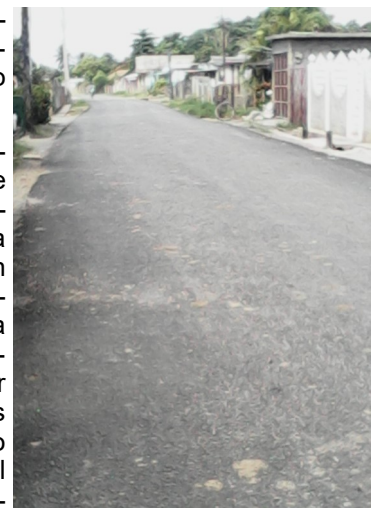
Vía de acceso asfaltada al poblado Godínez

La localidad Godínez, se encuentra a cinco kilómetros de distancia de la ciudad, comienza en la avenida 43; y alberga unos cuatro mil habitantes en total, que a diferencia del pasado donde el polvo penetraba por sus vías respiratorias y viviendas, ahora ya transitan por su vía sin limitación diferentes medios de transportación. Solo falta restablecer el acceso del transporte público y ambulancias en prestación de auxilios.