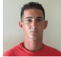
Por: Cecilio R. Valgas Cubano de a pie