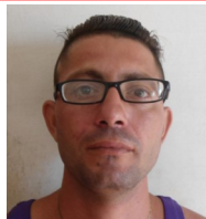
Por: Manuel Maura Cubano de a pie