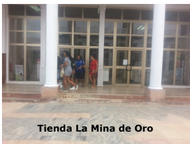
Tienda La Mina de Oro