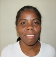
Por: Arodis Pelicé Periodista Ciudadano