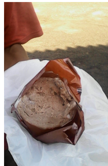
Una de las víctimas mostrando el producto (la jamonada)

hacerlo". El producto cárnico es elaborado en el Matadero Cárnico 'Fulgencio Oroz' que recibió una inversión que convirtió como nuevas todas sus instalaciones, acción que favoreció y humanizó el proceso de producción en la planta, sin embargo los ciudadanos se preguntan del por qué la mala calidad de ciertos surtidos que salen de allí con la finalidad de llegar a los hogares de las familias a través de los comercios estatales.