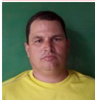
Por: Donel Baño Cubano de a pie