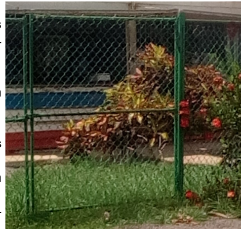
El Kiosco "La Loma"

de enfriar las bebidas se rompió, los cuatro dependientes tuvimos que desembolsar 10 cuc nuestros por cada uno, para arreglarla".