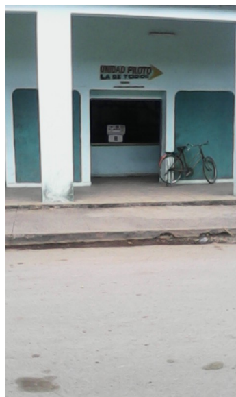
Bodega La Piloto

La empresa de productos lácteos, debe dar solución al problema que priva a los más pequeños de casa de poder sostener una alimentación adecuada con el imprescindible alimento que es determinante para estas edades en su crecimiento.