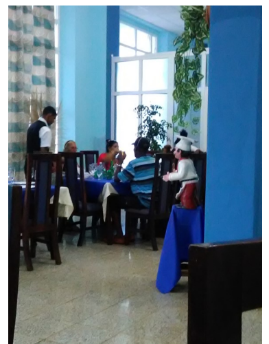
Sala de comensales del Hotel Campoamor