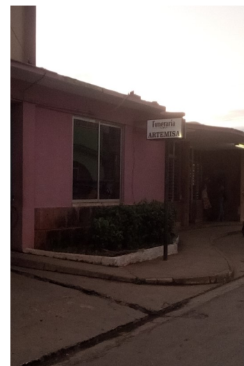
Funeraria de Artemisa