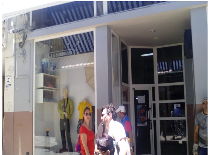
Tienda La Sorpresa