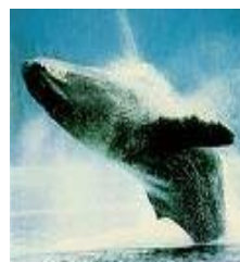
A Los gordos les decimos... ballenas, hipopótamos