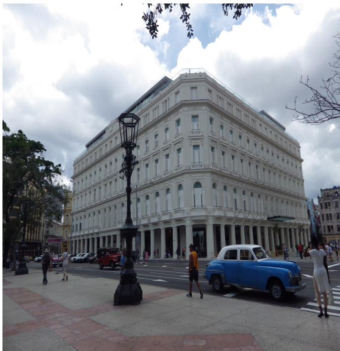
Imagen de la manzana de Gómez en su reapertura

H abana Vieja, La Habana, (ICLEP). Entran en operaciones, varias instalaciones del Hotel Manzana, el mismo cuenta con una capacidad de más de 500 habitaciones y espera satisfacer las expectativas de sus clientes. La inauguración contó con la presencia del ballet Litz Alfonso.