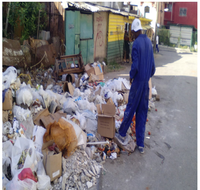
Imagen de acumulación de basura en la localidad

"Llevamos meses con la basura en las calle es criminal estar oliendo la putrefacción de todos esos desechos, aparte de las otras molestias que eso genera con la situación del transporte mi hija tiene carro y no lo podía parquear en el garaje" Comento Rosa María, vecina de la calle Apodaca