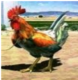
Un tipo busca pleitos es un ... gallito de pelea