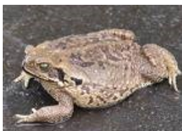
El que tiene mala suerte es un ... sapo