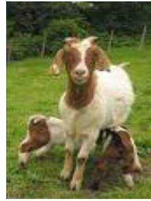
A Los delatores les decimos ... Chiva