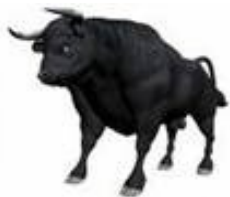
Un hombre fuerte es un ... Toro