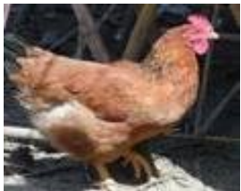
El que se echa pa'tras es una una ... gallina