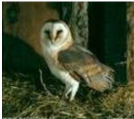
El que nos trae mala suerte es una ... Lechuza