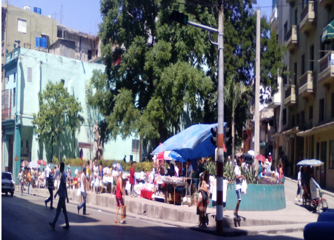
Feria ubicada en esquina Monte Y Águila

H abana Vieja, La Habana, (ICLEP). Observan comerciantes privados, nuevas oportunidades, en la celebración del día de las madres. Artesanos innovan sus ofertas y aminoran los precios, como una estrategia en su gestión de ventas, ante un público que siente el peso de los altos precios.