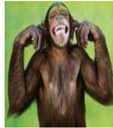
Si hay frío decimos que está chiflando el ... Mono