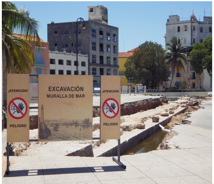
Imagen de las labores en el lugar

“Más de 30 años ha necesitado el Gabinete de Arqueología para exhibir los restos que apostan, más que nada, a ampliar el parque temático de la Muralla Marítima para el supuesto disfrute de habaneros y visitantes” Argumentó un trabajador del gabinete de arqueología, quien prefirió hablar en condición de anonimato.