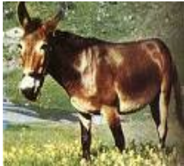
Para nosotros, una persona bruta es un ... Burro