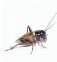
La mujer que es muy flaca, es un ... Grillo