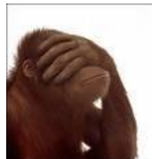
Al que imita también se le dice ... Mono