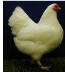
La mujer bonita es ... tremendo pollo