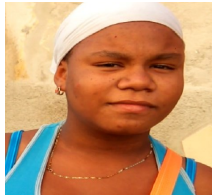
Por: Yanaisa Cuellar Cubano de a pie