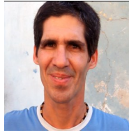
Por: Carlos Ulacia Cubano de a pie

Después de esta ronda, los del Argentina comanda la tabla de posiciones con 19 unidades, perseguido de cerca por San Felipe 1 (17 puntos) y San Agustín 1 (16 puntos). Por el mismo orden la clasificación la cierran La Salud, Los Güiros, San Felipe 2 y San Agustín 2.