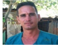
Por: Adrián Díaz Cubano de a Pie