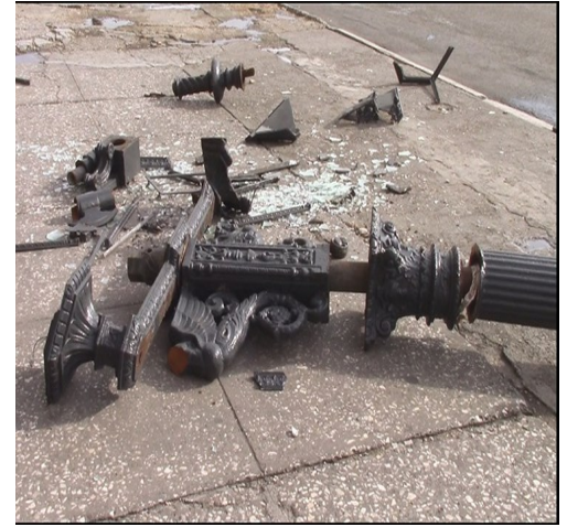
Daños ocasionados por el huracán Irma

Izquierdo, puntualizó que hacia el oeste ya se había estabilizado el servicio en los municipios Batabanó, Melena del Sur, Quivicán Bejucal.