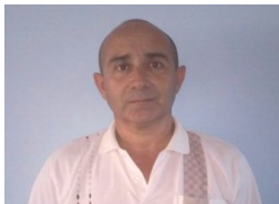
Por: Ernesto Almenares Periodista Ciudadano