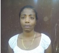
Por: María Rojas Cubano de a pie