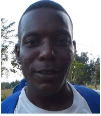
Por: Yasiel L. de la Torre Cubano de a pie