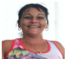
Por: Yamileth Díaz Cubano de a Pie

gobierno mediante arrendamiento, serán sometidas a una auditoría que buscaría detectar malos manejos o manifestaciones de corrupción administrativa.