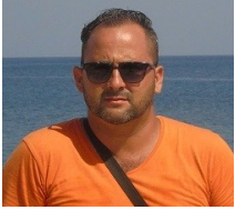
Por: Osniel Carmona Periodista Ciudadano