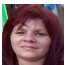
Por: Maday Romero Cubana de a pie

Santa Clara, (ICLEP). La tienda virtual de esta ciudad solo está satisfaciendo a personas que se dedican al negocio ilegal y a la reventa de mercancías, es lo que opinan los santacolareños que todos los días tratan infructuosamente de comprar los productos que allí se anuncian.