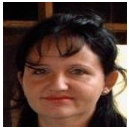
Por: Tania Puig Cubana de a pie