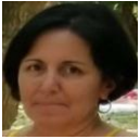
Por: Dalia Gómez Cubana de a pie