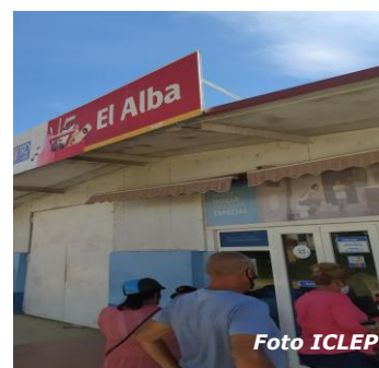
Tienda TRD El Alba