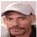
Por: Alain Betancourt Cubano de a pie