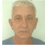
Por: Orestes Barceló Pérez Cubano de a pie.

Sancti Spiritus, (ICLEP). Continúa el equipo espirituano de Los Gallos en la cima de la actual serie nacional de beisbol, ahora con la incorporación de figuras importantes que han reforzado su ofensiva.