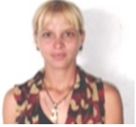
Por: Elianis Pérez Delgado Cubano de a pie

Sancti Spiritus, (ICLEP). Auditoría fiscal detecta desvío de recursos, malversación y falsificación de documentos en Empresa de Comercio y gastronomía del municipio de Jatibonico.