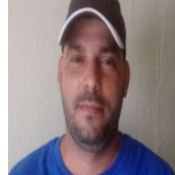
Por: Euyesmys Gutiérrez Cuba Cubano de a pie.

Para estos tiempos tan difíciles nuestra voluntad no puede ser sierva de la mente colectiva si queremos ser hombres y mujeres diferentes, la capacidad de crear, soñar y esperar es solo nuestra, y no siempre los sueños de todos los hombres coinciden, por cuanto somos únicos e irrepetibles. Aprendamos a mover nuestras ideas, no las prestadas o sugeridas.