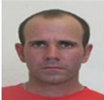
Por: Fauri Martín González Cubano de a pie