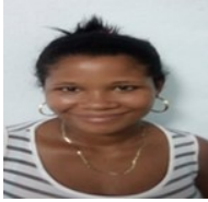
Por: Yuneski Ferrer Portal Cubano de a pie