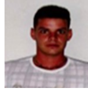
Por: Orelvis Hernández Pérez Cubano de a pie

Sancti Spiritus, (ICLEP). Padres de alumnos que cursan estudios en el Politécnico de oficios Estanislao Gutiérrez reclaman a las autoridades educativas que mejoren la crítica situación constructiva que presenta de este centro educativo, las que afectan a los internos.