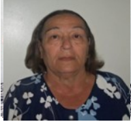
Por : Mirtha Noyola Camejo Cubano de a pie

Sancti Spiritus, (ICLEP). Nuevas políticas de precios a los productos, impuestas por la dirección del gobierno en la provincia, afectan sensiblemente al sector cuentapropista espirituario, quien hoy rebasa los 2 500 trabajadores.