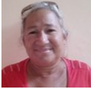
Por: Maura Aragón Alemán Cubano de a pie