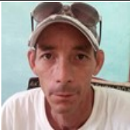
Por: Mario Pestana Dorta Cubano de a pie