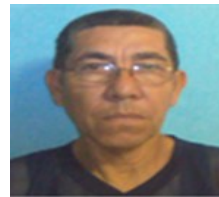
Por: Carlos Manuel Cárdenas Cubano de a pie.

Innumerables son los ejemplos de restricciones a la información en el mundo actual, la mayoría de ellas movidas por el temor a que los individuos conozcan las realidades y oportunidades que le rodean o por el temor a perder el control político, no obstante a ello no hay razón alguna que justifique a ningún ser humano el limitar el acceso a la información, esto lejos de ser útil puede llegar a convertirse en un gran problema y peligro, por cuanto los seres humanos somos muy propensos a cuestionarnos e indagar el porqué se nos prohíben ciertas cosas que no entendemos. Es necesario confiar en el hombre y brindarle la