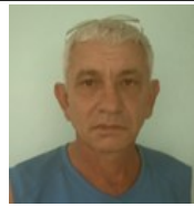
Por: Orestes Barceló Pérez Cubano de a pie