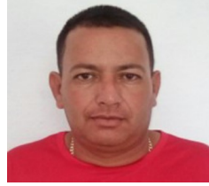
Por: Ángel Reyes Echemendía Cubano de a pie.

No se puede entregar los destinos y esperanzas de todo un pueblo a aquellos que escudados bajo el ropaje de dirigentes honestos, están esquilmando como lobos rapaces el fruto del trabajo de los demás.