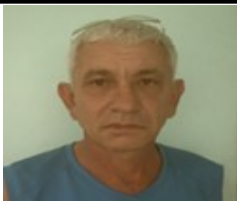
Por: Orestes Barceló Pérez Cubano de a pie