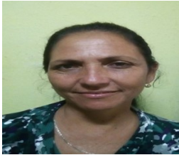
Por: Lourdes Fernández Chirino Cubano de a pie