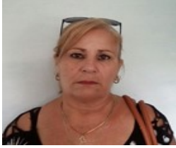
Por: Deysi Martínez Jiménez Cubano de a pie