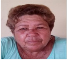
Por: Mercedes López Santana Cubano de a pie