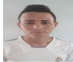
Por: José Quintana Rodríguez Cubano de a pie.