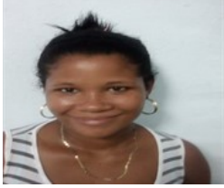
Por: Yuneski Ferrer Portal Cubano de a pie