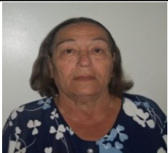
Por: Mirtha Noyola Camejo Cubano de a pie