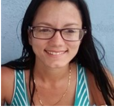
Por: Yuneisy Rivas Duanes Cubano de a pie