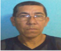
Por: Carlos Manuel Cárdenas Cubano de a pie