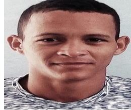
Por: Jorge González Gallo Cubano de a pie.