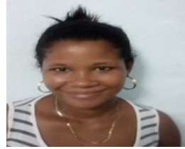
Por: Yanjeski Ferrer Portal Cubano de a pie.