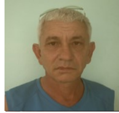
Por: Orestes Barceló Cubano de a pie