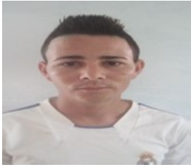
Por: Josué Quintana Rodríguez Cubano de a pie.