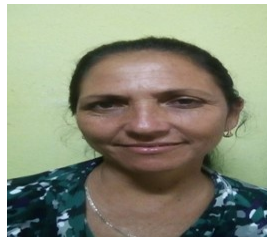
Por: Lourdes Fernández Cubano de a pie.

Como individuos tenemos que desarrollar la capacidad y el compromiso de defender nuestros criterios, ese es un derecho natural y legal que posee el hombre. No pueden los individuos ser entes pasivos en la vida social o callar cuando se debiera de hablar por temor a expresar sus ideales delante de otros que no la toleran por determinadas razones, pues como expresase Gilbert Keith Chesterton, escritor británico: "La intolerancia puede ser definida aproximadamente como la indignación de los hombres que no tienen opiniones" y esto es peligroso, pues quien calla por temor es esclavo de su