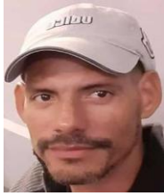
Por: Alain Betancourt Cubano de a pie

Los criadores de palomas mensajeras que integran la Asociación Colombófila de Cuba en la provincia de Villa Clara, aseguran que si el Estado Cubano no les facilita una vía segura donde conseguir los alimentos y medicamentos necesarios para sus animales, miles de estas hermosas aves