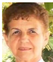
Por: Grisel Estrada Cubana de a pie