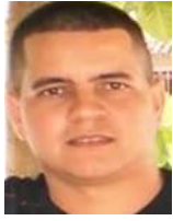
Por: Yasel Machado Cubano de a pie

Santa Clara, (ICLEP). Una tormenta eléctrica ocurrida el pasado día 5 de agosto dejó sin servicio de internet a toda la ciudad, provocando graves daños a los servidores y demás instalaciones técnicas, e innumerables quejas de los clientes que se vieron afectados.