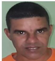
Por: Enrique Valdez Cubano de a pie

“Esto lo que demuestra es la terrible situación económica que enfrenta el país y la incapacidad del gobierno de resolver el problema de la alimentación del pueblo. Ojalá que se encuentre alguna alternativa porque si no esto se va a convertir en una catástrofe alimenticia”, aseguró.