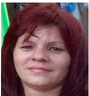
Por: Maday Romero Cubana de a pie