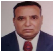
Por: Víctor Menéndez Cubano de a pie