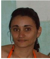
Por: Katia Pérez Cubana de a pie

Santa Clara, (ICLEP). Las entidades pertenecientes al Banco Popular de Ahorro ubicadas en el consejo centro de esta ciudad, desde el inicio del presente mes están presentando problemas con el efectivo, lo que ha provocado quejas de las personas que necesitan de realizar extracciones en las cajas habilitadas para esas operaciones.