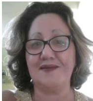
Por: Silvia Méndez Cubana de a pie

La fuente agrega, que si el gobierno no acaba de satisfacer las demandas recreativas de sus ciudadanos, esa situación podría desencadenar una crisis social sin precedentes, porque lo que si no puede faltarle al cubano es el entretenimiento.