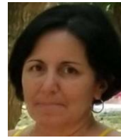
Por: Dalia Gómez Cubana de a pie

Santa Clara, (ICLEP). Catorce trabajadores pertenecientes a la brigada once de mantenimiento y viales en la provincia de Villa Clara, están exigiendo a esa entidad estatal que les pague sus salarios correspondientes a los meses de marzo, abril y mayo los cuales trabajaron a préstamo en labores agrícolas en la empresa Valle del Yabú.