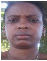
Por: Yailen Torres Cubana de a pie

Santa Clara, (ICLEP). La agencia turística Islazul no ha podido satisfacer la demanda de reservaciones para sus instalaciones durante el presente verano, lo que ha creado mucho disgusto en miles de ciudadanos que están ansiosos por pasar unas refrescantes vacaciones en esos hoteles.