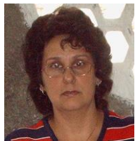
Por: Lisandra González Cubana de a pie