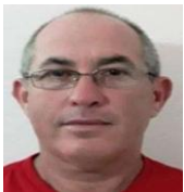
Por: Camilo Rodríguez Cubano de a pie