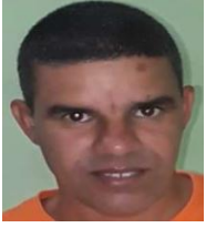
Por: Enrique Valdez Cubano de a pie

La vida de la gran mayoría de los cubanos de hoy se ha convertido en una especie de lucha por la supervivencia. Con el pasar de los años y casi sin darnos cuenta hemos ido involucionando, poco a poco dejamos de ser una sociedad racional y nos convertimos en una selva en la que todos se