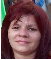
Por: Maday Romero Cubana de a pie

Santa Clara, (ICLEP). Hace ya tres semanas que no se vende pan liberado en las panaderías y puntos de venta establecidos en esta ciudad, lo que ha creado gran preocupación y malestar en una población cada vez más necesitada de este alimento.