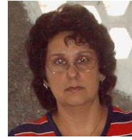
Por: Lisandra González Cubana de a pie

Santa Clara, (ICLEP). La gran mayoría de los trabajadores por cuenta propia de esta ciudad se encuentran sin atención de las autoridades desde que comenzó el aislamiento social, esto ha motivado muchas quejas en un sector que ve como los trabajadores estatales reciben beneficios de los cuales ellos están completamente excluidos. Unos cincuenta mil trabajadores privados permanecen sin realizar sus trabajos y por ende sin ninguna entrada económica desde finales de marzo pasado, tampoco han podido acceder a las ventas de productos de primera necesidad que muchas empresas estatales han realizado a sus trabajadores luego de las medidas restrictivas.