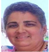
Por: Noelia Santos Cubana de a pie

Santa Clara, (ICLEP). Los residentes del reparto Moro están exigiendo a las administraciones de los restaurantes de la presa Minerva que vuelvan a retomar las ventas de comida cocinada que se realizaron durante las dos primeras semanas del aislamiento social.