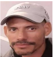
Por: Alain Betancourt Cubano de a pie