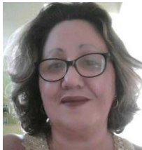
Por: Silvia Méndez Cubana de a pie

“Si se vendiera el producto aquí todo sería muy diferente, se acabarían las especulaciones y las personas resolverían sus necesidades”, agregó.