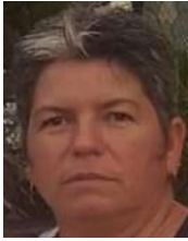
Por: Laura Rivero Cubana de a pie

Santa Clara, (ICLEP). Los pobladores del poblado La Guayaba ubicado en la carretera a Manicaragua, están solicitando desde hace meses a las autoridades del gobierno en ese lugar que les garanticen la venta de cloro a precios accesibles.