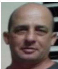
Por: Gustavo Mena Cubano de a pie

Santa Clara, (ICLEP). La pasta dental que se anunció en marzo pasado que debía distribuirse mensual a través de la libreta de abastecimiento, ahora solo se venderá cada cuatro meses, lo que ha creado gran preocupación en una población que no encuentra alternativas en la sustitución de tan preciado producto de higiene.