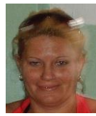
Por: Migdalia Suarez Cubano de a pie

Santa Clara, (ICLEP). Nueve edificios de apartamentos ubicados en el Reparto Escambray muy cercanos al Hospital Provincial Arnaldo Milán, permanecen desde hace más de una semana sin agua, debido a que la empresa eléctrica le retiró la corriente a la turbina destinada a bombear el líquido hacia los tanques situados en las azoteas de las mencionadas edificaciones. Alcides Pérez funcionario de la empresa eléctrica que ejecutó el corte del servicio explicó a este reportero, que el motivo por el que se decidió tomar esta medida fue el incumplimiento reiterado de los pagos correspondientes por la