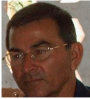
Por: Fidel Sánchez Cubano de a pie

El aumento del consumo y la utilización de plantas en la prevención y tratamiento de enfermedades observados en la población de Villa Clara durante los últimos meses, más que el rescate de una antigua tradición es una necesidad en tiempos de escasez y falta de medicamentos.