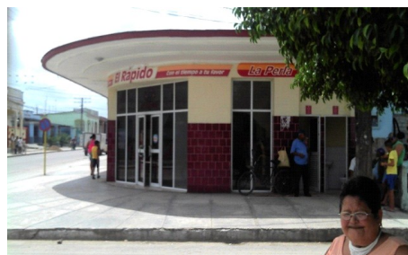
Antigua Perla, hoy Cafetería "El Rápido"

Respecto a la cantidad sustraída por el asaltante, las opiniones discrepan unas de otras, estas alegan por separadas cantidades diferentes nunca superior a los 500 CUC. Un hecho extraño en este acontecimiento según