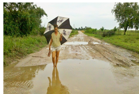
Vía de acceso a la comunidad 26 de Julio