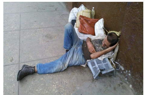
Indigente pernoctando en la calle

Razones sobran para demostrar que la pobreza e indigencia son huéspedes indeseables en el panorama social cubano. Si alguien no lo percibe así, solo nos queda recordar la popular sentencia que dice que "no hay peor ciego que aquel que no quiere ver".