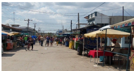
Calle Villuendas desolada

La semana de la cultura jatiboniquense, ese espacio de intercambio, alegría y recreación cultural que anualmente esperan los habitantes de esta localidad, transcurrió este año en medio de una profunda falta de motivación ciudadana, que se apreció en la poca participación de la población en dichos festejos, apreciándose en diferentes horarios del día las calles de la ciudad prácticamente desiertas. La carencia de recursos financieros y los