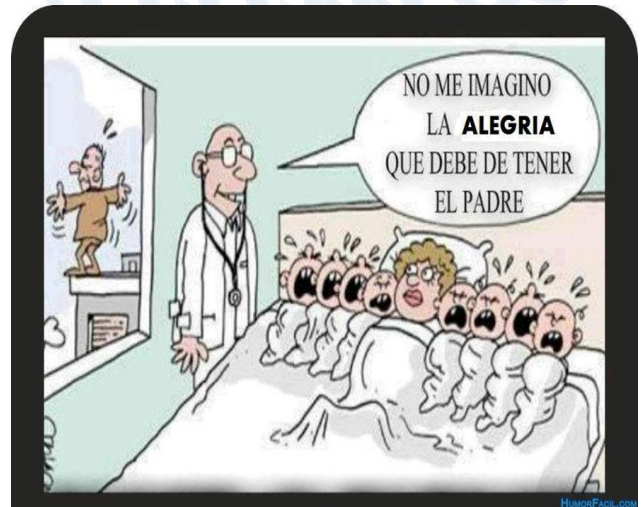
Tomado de humor grafico