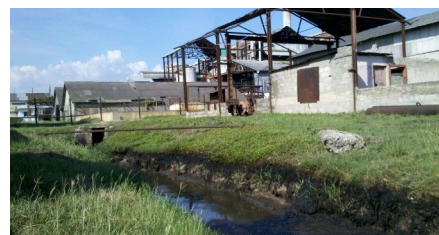
Zanja por donde vierten los residuos