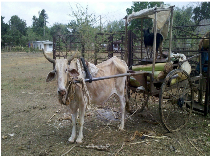
Acarreo alternativo para campesinos de la zona