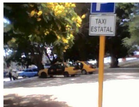
Piquera de taxi en Hospital Provincial