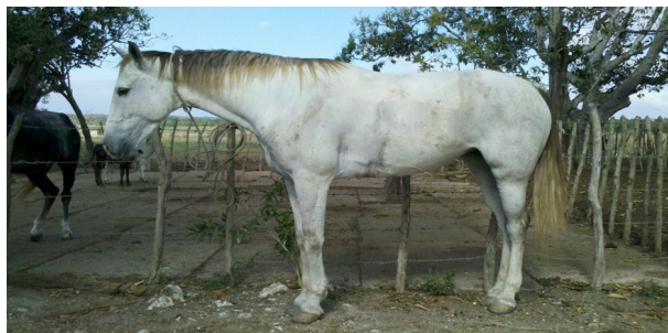
Animales de la zona vedada

"Es absurdo mantener estas posiciones hacia los campesinos y productores que son al final los que más se esfuerzan en mantener sus animales en buen estado", aseveró un vecino de la comunidad La Vega, quien omitió su nombre.