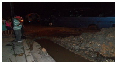
Yutong atascada en las calles