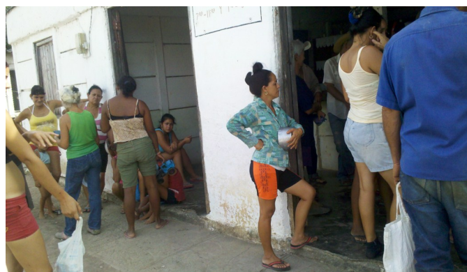
El diario vivir de los cubanos

Calidad de vida es ser protagonista de nuestra propia existencia, es sinónimo de satisfacción y realización personal. Para el cubano, que forzado por las circunstancias, se ha convertido en un economista y analista empírico, la calidad de su existencia como ser humano no es ni podrá ser jamás una simple alocución oficial con promesas de milagros: debe ser voluntad y acción orientada al cambio