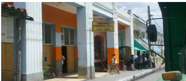
Farmacias del territorio provincial