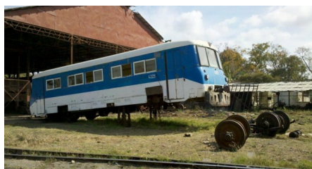
Coche motor en reparación

A principio de este mes, la guaguas que cubrían a las comunidades en estos momentos han dejado de funcionar por no haber pasado