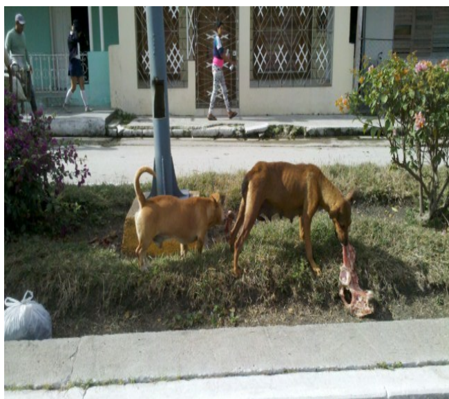
Desperdicios y perros en las calles