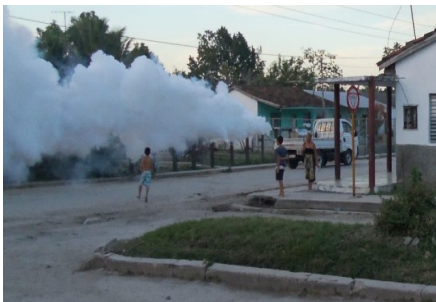
Equipo fumigando las calles

Sancti Spíritus. Aumentan preocupaciones de autoridades sanitarias provinciales el notable incremento en los últimos días de dengue en diferentes municipios y repartos de esta cabecera provincial.