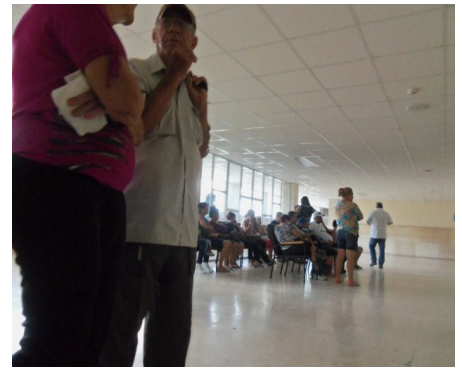
Salón de espera laboratorio clínico

este es el típico trato que por desgracia reciben nuestros ciudadanos por parte de algunos profesionales de la llamada potencia médica cubana. Comentario de un profesional de la salud.