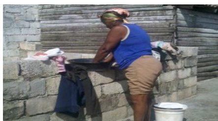
Vecina de Los Güiros

Jatibonico, Sancti Spiritus. Habitantes del caserío Los Güiros demandan a las autoridades del gobierno municipal, solucionarles el problema del agua, que durante años han padecido del mal, teniendo única y exclusivamente que adquirir el líquido a través de una pipa tirada por un tractor.