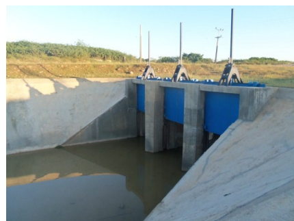
Compuertas canal magistral

con el agua, aunque pagáramos por ella, esperemos que piensen en esta posibilidad que también nosotros pudiéramos utilizarlas con fines económicos. Ya que, al final quien más pierde es el pueblo, que no le podemos ofertar todo lo que es capaz de producirse en estos suelos si tuviéramos regadíos.