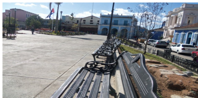
Parque Serafín Sánchez Valdivia

Los maratónicos trabajos realizados a raíz del 500 aniversario de la fundación de esta villa provocaron la reconstrucción a su diseño original, del Parque Central Serafín Sánchez, el cual después del derroche de cuantiosos recursos y de ser objeto de importantes hallazgos arqueológicos, sufrió la destrucción de los hermosos árboles que brindaban su bondadosa frescura al cansado cubanito de a pie.