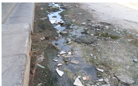
Calle: Tello Sánchez

El 29 de febrero vecinos de la citada calle manifestaron a este reportero, con marcada incredulidad y hasta cierto punto desconfianza, su preocupación por solucionar el crítico estado constructivo e