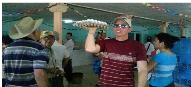
Mercadito de la localidad

Un cliente cuyo nombre no quiso dar, nos dijo " compré sólo este file porque no traigo más dinero, pero sino, me hubiera llevado dos o tres, y agregó: si no aprovechamos hoy, después no hay donde conseguirlos".