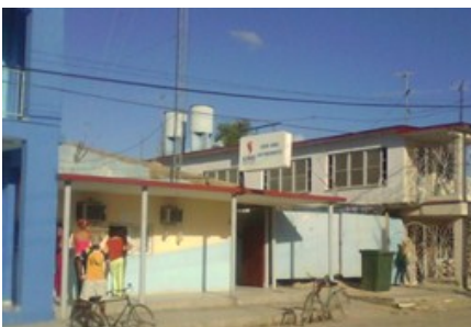
Empresa Eléctrica Municipal

Jatibonico, Sancti Spiritus. En medio de constante malestar, generador de estados de opinión negativos e impotencia, los ciudadanos del municipio Jatibonico sufren los impactos que ocasiona el incremento continuo de las tarifas de consumo eléctrico. La gente no comprende porqué cada mes el monto a pagar es superior. Lo crítico del asunto: la Empresa Eléctrica Municipal no tiene respuesta ante los reclamos de la población.