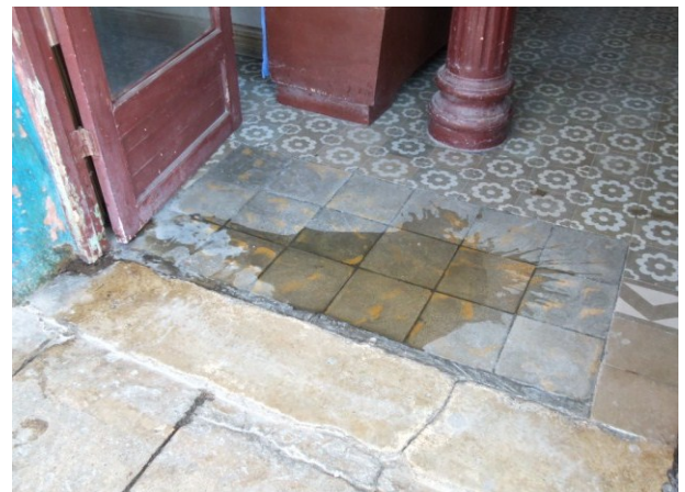
Orina dentro de la ferretería

Una trabajadora de la ferretería, "El Radio", quien pidió no publicaran su nombre, el 21 de diciembre, comunicó a esta reportera que el portal de su centro laboral se ha convertido en un lugar desagradable. Situación poco favorable para la gestión económica de su entidad; pues, es extraño el día en que los desechos humanos no aparecen dentro de la tienda.