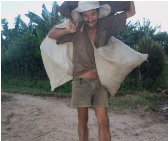
Recolector de materias primas en Localidad El Patio