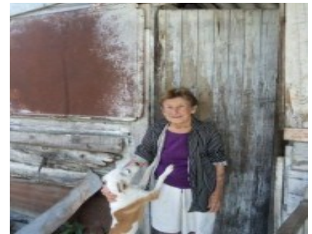
Rosario en la humilde morada

Cuando empeoran las condiciones climáticas, las cuatro maltrechas paredes que esta familia tiene por vivienda parecen colapsar.