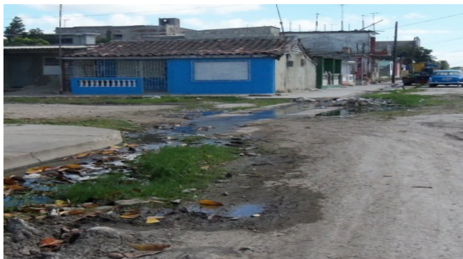
Calle José Miguel Gómez

Según los pobladores, habrá que esperar al próximo año y un nuevo presupuesto para salvar un espacio que fue referencia del patrimonio arquitectónico local.