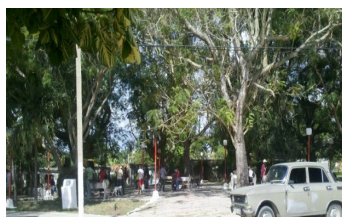
Parque de Arroyo Blanco

Sin embargo, el sitio se ha convertido en lugar de conflictos y peleas callejeras que alteran la tranquilidad ciudadana y que amenazan con desembocar en lesiones a ciudadanos de diferentes edades que frecuentan el lugar en busca de descanso y recreación".