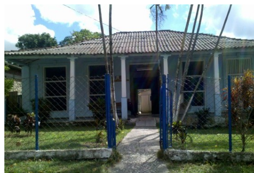
Puesto medico afectado por estas medidas

Sin considerar las implicaciones que trae consigo esta decisión, determinó, a fin de "ahorrar", fijar una tarifa de consumo eléctrico a los consultorios médicos locales. La suma a abonar es tan considerable que virtualmente ha obligado a estas instituciones a reducir de manera apreciable sus servicios a la comunidad. Lo que colmó la paciencia de los lugareños, según testigos de los sucesos, fue cuando un promedio de cerca de 20 personas, incluyendo niños, ancianos y embarazadas, acudieron a una de estas instituciones locales con la finali-