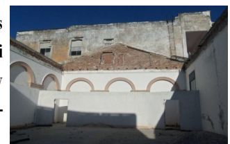
Interior de Casa de la Cultura

La Cultura, el Patrimonio y los Abuelos se parecen mucho: si no los cuidan con amor y respeto, pronto mueren, Comentaron algunos