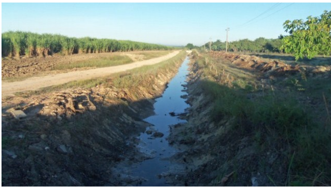
Canal de riego de unos 5 km destruidos

Jatibonico, Sancti Spíritus. Ciudadanos de la localidad de El Cieguito, vieron con dolor cómo vándalos, ante las miradas de todos, destruían indiscriminadamente los canales de riego con el solo fin de sustraer los aceros que poseen estas losas y muros para venderlos en el mercado negro de esta localidad, sin que se personara ninguna autoridad legal para frenar estos actos