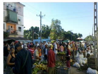
Comerciantes en la feria

Estos comerciantes esperan una rápida intervención estatal contra este mal que laceran sus ingresos, después de pagar las tarifas establecidas para comercializar sus productos.