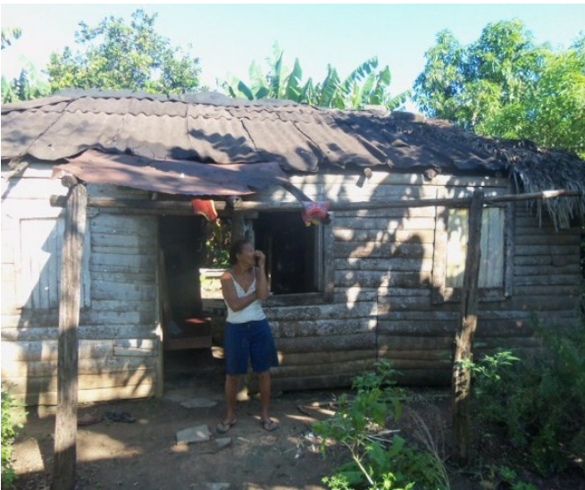
Vivienda de habitantes en localidad de El Patio