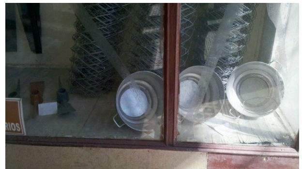
Algunos insumos en tienda creada por el gobierno

En reunión ordinaria, los campesinos de la CCS Emilio Obregón. Al igual que en otras, protestaron ante representantes de su entidad y funcionarios del gobierno por las presiones a que son sometidos constantemente. Esto se refiere a los planes