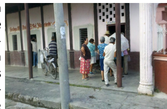
Ciudadanos esperan por la Leche