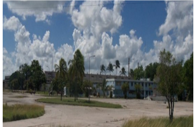
Papelera de Jatibonico

Otro elemento, para no creer en justificaciones ni en lágrimas salidas de bolsillo ajeno es el desempleo en la zona. En la puesta en marcha se contaba con un aproximado a 1800 trabajadores.