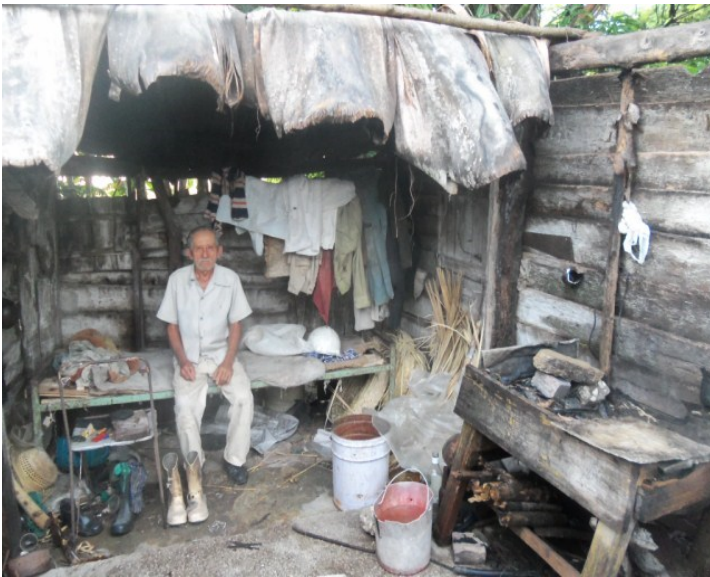
Vivienda de un campesino en la localidad El Cieguito