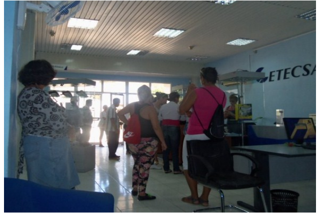
Oficinas de ETECSA Municipio Jatibonico

"Yo no sé de qué forma nos vamos a conectar con el mundo en medio de tantas trabas. Cola para comprar el pan, cola en la farmacia, cola donde quiera; ni esto moderno escapa a la miseria que se vive en este país. ¡Si mi hija quiere!, que se conecte ella conmigo. Me voy para mi casa, me duelen mucho las piernas", declaraciones de una señora que tiene una hija residente en España y quien no quiso identificarse.