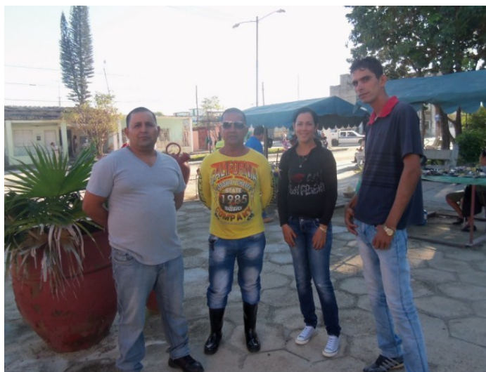
4 de los 6 cuentapropista que aún laboran

Los trabajadores que aún permanecen en función alegan que están unidos, algo que siempre ha preocupado a los regímenes totalitarios. Además, de pretender exigirle a las autoridades locales que los regresen a su antiguo lugar de labor; o que lo trasladen a otro sitio donde puedan mejorar sus ventas.