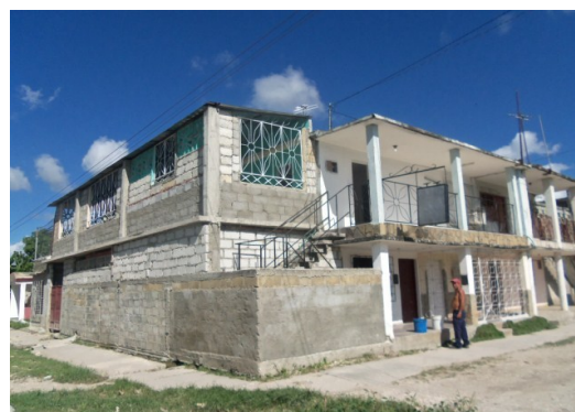
Una de las casas robadas en Jatibonico

Las instalaciones estatales no escapan a este mal social. La farmacia, ubicada en la franja de los edificios, fue defalcada recientemente. Hay varios sospechosos detenidos y ningún culpable que las autoridades puedan presentar públicamente como autor material de dichos delitos. La gente ya no confía en la policía y tratan de proteger sus bienes a toda costa. Es el comentario del momento. Se habla de: enrejar las casas, poner alarmas, permanecer alerta toda la noche. Sin embargo, por lo reiterativo de los comentarios, nada de esto les quita el temor de amanecer escamoteados.