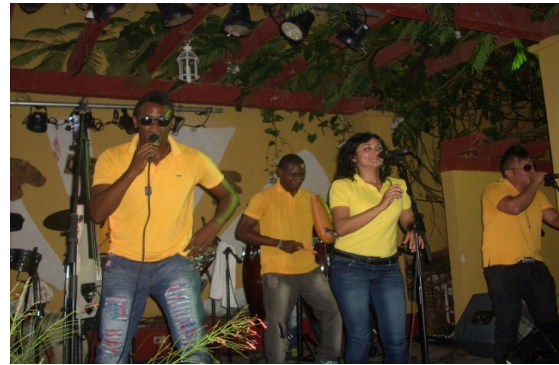
Grupo Imagen, municipio Jatibonico

Además, no le son facilitadas las mínimas condiciones para ejercer la labor. Muestra de esto es: deficiente promoción que traspase las fronteras de la provincia, es ocasiones los mismos artistas deben cubrir los costos del hospedaje y alimentación y muchas veces hasta el propio transporte.