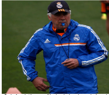
Carlo Ancelotti respondió a las declaraciones de Joseph

"Me sorprende lo que hace el presidente, pero qué tenemos que hacer, es imposible callar la boca al presidente de la FIFA", respondió Ancelotti cuando fue preguntado por la opinión de Blatter.