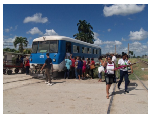
Coche motor o Cascal

"Hasta los Cascales (nombre dado por la gente de la zona a los trenes coche motor) se han perdido de los campos. Para qué volver a quejarse al Gobierno y al Partido, ya sabemos la respuesta: no tenemos combustible", dijo una mujer que llevaba varios días tratando de extraerse una muela.