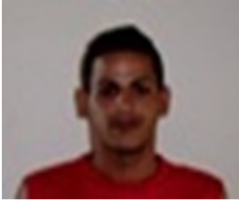
Por: Adrian Acosta Bernal Cubano de a pie.