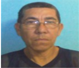
Por: Carlos Manuel Cárdenas González Cubano de a pie.