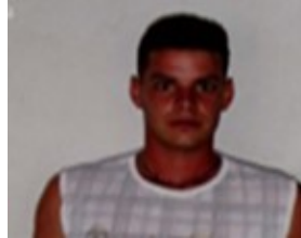
Por: Orelvis Hernández Pérez. Cubano de a pie.