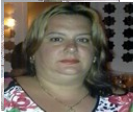
Por: Lanyen Sánchez Ruberts Cubano de a pie.