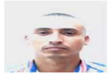
Por: Yaisel Segura Matos Cubano de a pie.

Una bolsa de puré de patatas en polvo de 30 gramos cuesta a 2.50 CUC, la carne de res o picadillo 4.05 CUC el kilogramo, una botella de un litro de aceite vegetal a 5