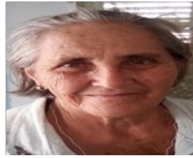
Por: Eloina Ríos Tamayo Cubano de a pie.