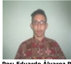
Por: Eduardo Álvarez Ruíz Cubano de a pie.

Hablar de una verdadera sociedad civil en Cuba es tener en cuenta a todos y que tengan el derecho de participar y exigir cuentas al gobierno sobre las cuestiones más básicas del poder: la transparencia, la participación, la democracia y el respeto a los derechos humanos y civiles. Es esta la verdadera esencia de la sociedad civil.