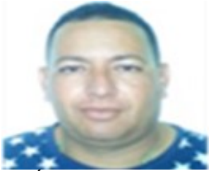
Por: Ángel Reyes Echemendía Cubano de a pie.

Sancti Spíritus, (ICLEP). Desde hace varios meses se hace sentir en esta provincia la escasez de fósforos en los principales establecimientos y dependencias de comercio y gastronomía, como resultado del prolongado desabastecimiento de este producto por parte de las empresas nacionales encargadas de suministrar el mismo.