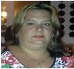
Por: Lanyén Sánchez Rubert Cubano de a pie.