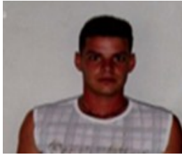
Por: Orelvis Hernández Pérez. Cubano de a pie.

Como una más de las tantas problemáticas que agobian al cubano de estos tiempos, está el reto diario que encierra el poder distinguir y tener conciencia de cuales de sus actos o acciones pueden ser considerados legales o ilegales. Este parece ser un tema preocupante para la mayoría, que cada día se ve obligada a tomar alguna que otra decisión para sobrevivir y lo hace con el temor de verse sometida a un inesperado proceso, por violar la legalidad, y es que esa línea entre lo lícito o lo ilícito en Cuba parece ser muy frágil y apenas es posible distinguirla. Tales desafíos parecen ser algo imposible de comprender aun para el mejor de los expertos, pues el sistema legal cubano se mueve en un constante trasiego, donde decretos, cartas circulares y reglamentos se modifican arbitrariamente de manera constante y en muy pocas ocasiones se ajustan a un marco sancionador que beneficie al ciudadano común. Una mirada rápida a algunas de las leyes establecidas en los últimos tiempos permiten comprender como estas se han convertido en instrumentos jurídicos destinados a salvaguardar de manera general los intereses estatales, en detrimento de las personas naturales, a decir de algunos expertos no se atempera a la situación y tiempos que hoy se viven en nuestro país, convirtiéndose en una legislación obsoleta y poca ajustada a un contexto económico demasiado inestable y desesperanzador.