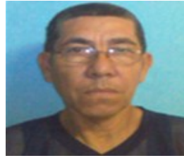
Por: Carlos M Cárdenas González Cubano de a pie.