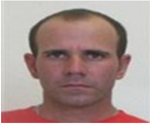
Por: Faubri Martín González Periodista Ciudadano

Sancti Spiritus (ICLEP). Vuelve a ser noticia la Unidad Empresarial de Base (UEB) de Transporte de este municipio, esta vez como resultado del profundo malestar de los choferes de transporte urbano debido al acoso de que son víctimas por parte de los directivos de esta entidad, al ser acusados y revisados públicamente delante de la población para confirmar si toman dinero de las alcancías.