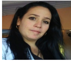
Por: Dianni Hernández Quinco-se. Cubano de a pie.

Sancti Spiritus, (ICLEP). Residentes de varias comunidades rurales de la provincia, denuncian el total abandono que presentan estas zonas en materia de recreación y cultura, como consecuencia de la poca gestión y escaso apoyo de las autoridades gubernamentales y de cultura.