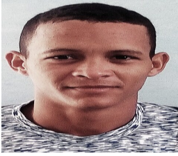
Por: Jorge González Gallo Cubano de a pie