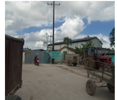
Patio de materiales

afectada explicó para este medio: " Vengo todos los días desde que perdí mi cocina y el bañito, y ya me da hasta pena preguntar: cuando vienen los recursos".