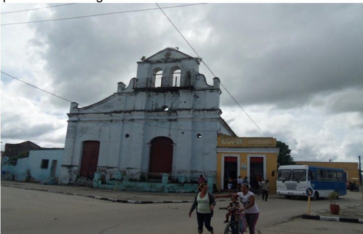
Iglesia Jesús de Nazareno