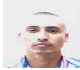
Por: Yaisel Segura Matos Cubano de a pie.

Colón, Sancti Spíritus, (ICLEP). Más de cinco mil núcleos familiares de los Consejos Populares Jesús María, Parque y Colón se han visto afectados al comprar su cuota mensual de gas, debido a que la Empresa del Gas Provincial abastece con solo cien balas diarias del producto, al único punto de venta existente en Colón.