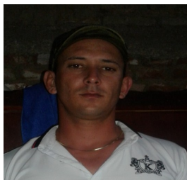
Por: Jorge E. Vera Farfán Cubano de a pie.

nesto Salgado inspector de comercio expresó: "Tanto estos cuentapropistas que alteran las tarifas, como administradores y otros trabajadores de mercados y tiendas han establecido entre ellos una red de distribución secreta, para unas pocas personas, que los adquieren y juegan con los precios a su antojo".