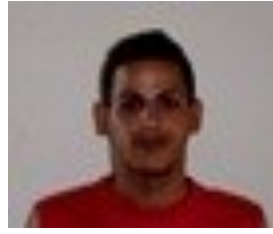
Por: Adrián Acosta Bernal Cubano de a pie.

Sancti-Spíritus, (ICLEP). Más de mil quinientos damnificados por el huracán Irma ,residentes en el Consejo Popular Kilo 12, transcurrido dos meses no han recibido los materiales asignados para la reconstrucción de sus viviendas, por no existir estos en los lugares habilitados para su venta.