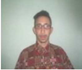
Por: Eduardo Álvarez Ruíz Cubano de a pie.

Sancti Spíritus, (ICLEP). Más de 100 residentes de la comunidad El Cieguito, con serias afectaciones en sus viviendas, tras el paso del Huracán Irma, aun esperan por los recursos necesarios para la edificación y restauración de sus hogares.