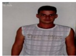
Por: Orelvis Hernández Pérez. Cubano de a pie.