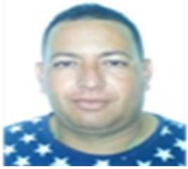
Por: Ángel Reyes Echemendía Cubano de a pie.

Jesús María, Sancti Spíritus, (ICLEP). La iglesia de Jesús Nazareno, ubicada en el conocido parquécito de Jesús, pleno corazón de esta ciudad, amenaza con desplomarse luego del paso de los años y un total abandono por las autoridades locales.