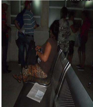
Área de admisión.