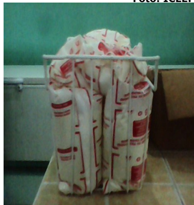
Bolsas de Yogurt Natural