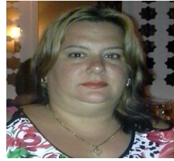
Por: Lanyén Sánchez Rubert Cubano de a pie