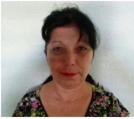
Por: Orlidia Barceló Periodista Ciudadano