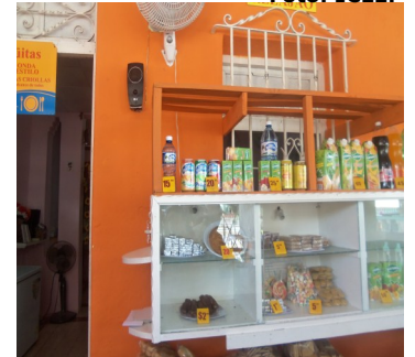
Punto de venta