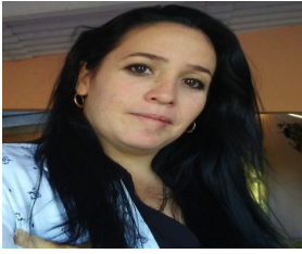
Por: Dianny Hernández Quincose Cubano de a pie.

El Patio, Sancti Spíritus, (ICLEP). El atraso en el pago de la leche acopiada al sector campesino, por parte de la Empresa de Productos Lácteos Río Zaza, ha generado cuantiosas pérdidas económicas a los campesinos de la Cooperativa de Créditos y Servicios Pastor Meneses, ubicada en el Consejo Popular El Patio, de este territorio.