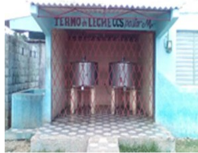
Termo de leche de la CCS