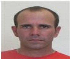
Por: Fauri Martín González. Periodista Ciudadano.