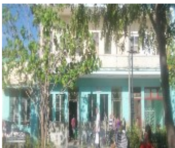
Funeraria en parque La Caridad

Para este medio de prensa declaró un trabajador, de la funeraria, quien prefirió el anonimato: "A pesar de que tenemos limitaciones, nada justifica lo que está pasando en el servicio que prestamos, nos hemos ganado el reproche de los dolientes".