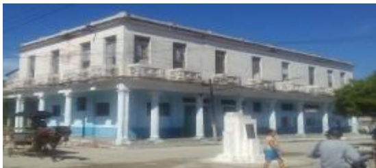
Inmueble el los altos de la funeraria

Este viejo edificio conocido como los altos de la funeraria sirvió como hogar a unas veinte familias jatiboniquenses, las cuales tuvieron que abandonar la instalación por peligros de derrumbe, situación