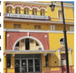
Cine Conrado Benítez