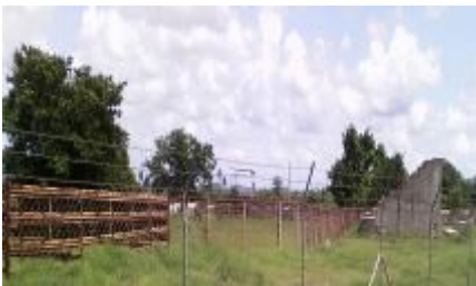
Pista de rodeo

La conocida y en otros tiempos concurrida pista de rodeo de jatibonico, ubicada en las afueras de la ciudad, en el reparto El seis, se deteriora poco a poco, ante el prolongado abandono y descuido de las autoridades de gobierno del municipio, quienes han dejado a merced de su suerte este emblemático sitio,