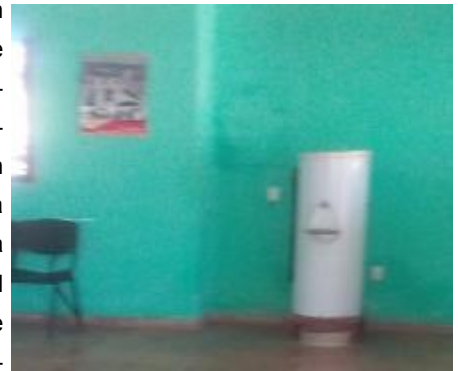
Bebedero desabastecido de agua

Desde hace aproximadamente un año existe esta situación la que ha sido planteada por perjudicados en diferentes instancias gubernamentales del municipio, sin que hasta el presente se haya actuado de forma positiva en la solución de un problema social que afecta a tantos. El 18 de agosto se suscitaron varias protestas por dichas irregularidades,