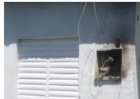
Metro contador de los afectados

"No creo justo que la población tenga que adquirir por sus medios y a precios excesivos un dispositivo tan importante, cuando abonan a la empresa eléctrica, un alto precio por kilowatt consumido, debieran brindarles ese servicio ellos".