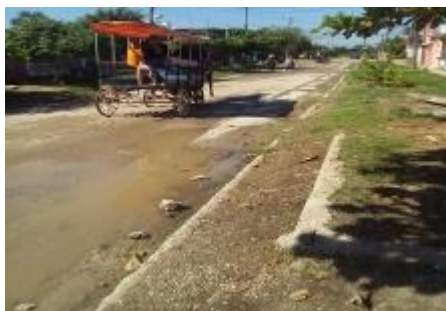
Calle Simón Reyes

Jatibonico, Sancti Spíritus (ICLEP). Múltiples son las quejas de amplios sectores de la población jatiboniquense, ante la decisión de las autoridades locales de trasladar la ruta de los coches hacia la calle Simón Reyes, situación