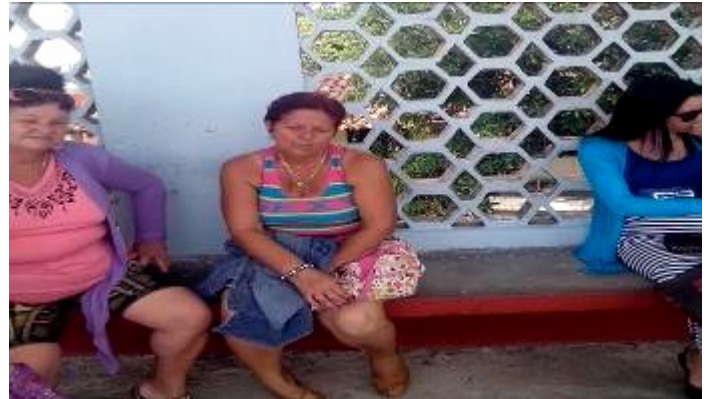
Faena diaria de las madres cubanas

Homenajear a las madres cubanas es sencillamente una sagrada obligación, es reconocerle el sacrosanto deber de