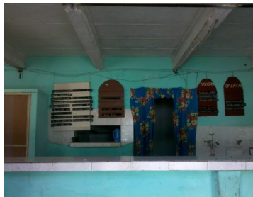
Merendero de la industria

En un entreabierto, se deja ver cómo la principal empresa azucarera de la provincia toma un rumbo fuera de órbita al iniciar una de tantas ingeniosidades que más allá de ocasionar turbulencia, quedará como una más de esas invenciones que se pierden en la memoria de los que la vivieron.