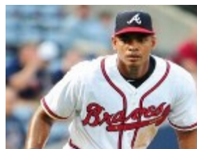
Héctor Olivera.

El jardinero cubano de los Bravos de Atlanta, Héctor Olivera, aceptó una suspensión de 82 juegos sin goce de sueldo por quebrantar el reglamento de violencia doméstica de las Grandes Ligas, informa AP.