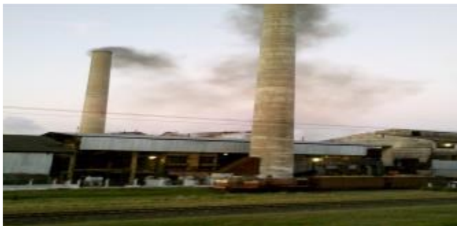
Complejo Agroindustrial Azucarero Uruguay