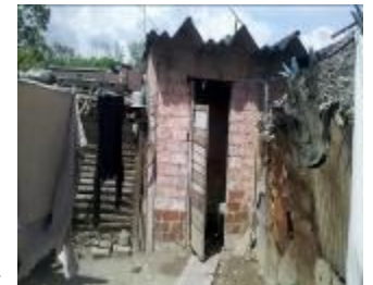
Letrinas en comunidad

Habitantes de la referida comunidad lanzan un llamado de alerta a las autoridades competentes para evitar una futura tragedia en la que se vean envueltos indefensos niños, ancianos, embarazadas y personal en general, que sólo piden se resuelva esta situación, y con ello les mejoren la calidad de vida.