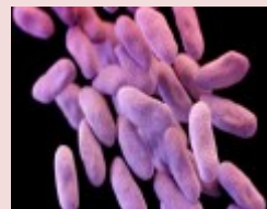
27 de mayo,

del Departamento de Defensa determinaron que era una cepa de E. coli inmune al antibiótico de colistina, según un estudio publicado el jueves por la Sociedad Americana de Microbiología. Los autores escribieron que el hallazgo "anuncia la aparición de una verdadera bacteria resistente a las drogas".