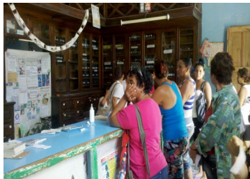
Farmacia que labora las 24 horas

Padres de jóvenes y adolescentes muestran su temor al percatare de que sus hijos e hijas acuden a las fiestas sin protección, y al no poder obtener estos obligados accesorios en lugares a fines, ponen sus vidas en riesgo, pues pueden ser proclives a