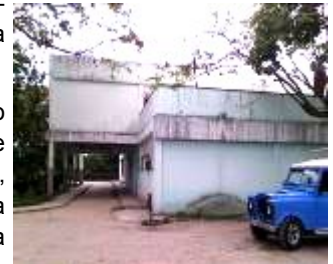
Hospital Mártires de Jatibonico

los cuales brillan por su ausencia, algo insólito para algunos, ya que no se explica, la indolencia que posee el departamento encargado de esta emergencia que afecta de forma directa a tantas personas..