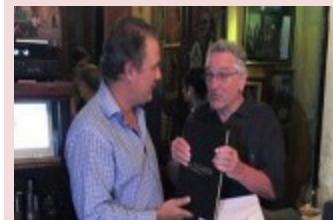
Robert de Niro en La Guarida.

En las fotos puede verse a De Niro sonriente rodeado de los trabajadores de ese restaurante. De Niro comió en La Guarida. La cantante española Marta Sánchez, Natalie Portman, Beyoncé y el rapero Jay-Z figuran entre