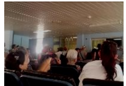
Área cinco de Oftalmología

personales, lo cual hace que no puedan trabajar como esta establecido, Súmasele a esta situación la cantidad de personas dentro de consulta las cuales superan en número de las que esperan en cola en la parte de afuera y el continuo llegar del personal con batas incluso cre-