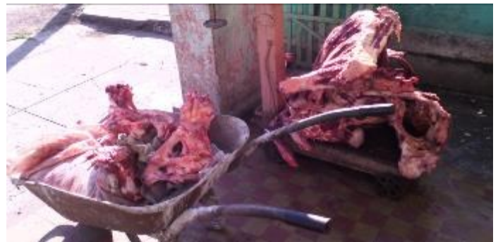
Huesos pelados en venta a la población

Ciudadanos que tuvieron palabras este veinticuatro de mayo, para este medio manifestaron su preocupación para los próximos meses de lluvias en los que el calor y la humedad son aliados para dañar los alimentos expuestos al medio ambiente como es la suerte que corren (Las Persianas) como llaman eufemísticamente a las costillas de res.