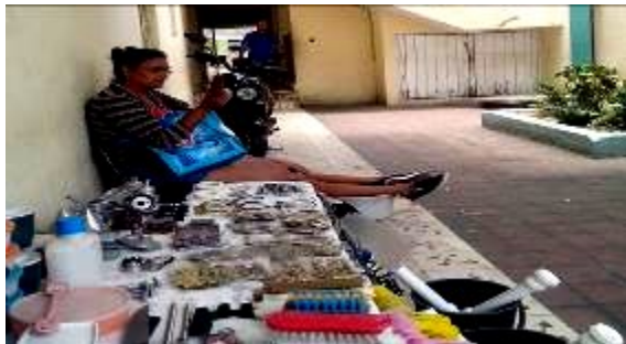
vendedora por cuenta propia

Como pólvora que lleva el viento se ha divulgado por estos días en la cabecera municipal las protestas y malestar de los cuentapropistas locales, ante