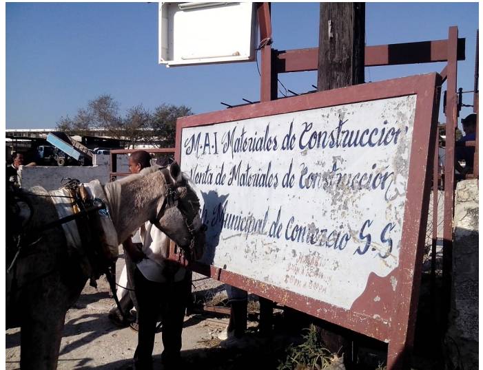
Almacén de venta de materiales de la construcción

Sancti Spiritus. Un clima marcado por el maltrato a la población, manejo indebido de materiales, irregularidades y negocios jugosos con la venta de cemento, entre otras violaciones son algunas de las afectaciones que sufren los espirituanos que se dirigen al patio de materiales de la construcción municipal, aledaño al Hospital Provincial.