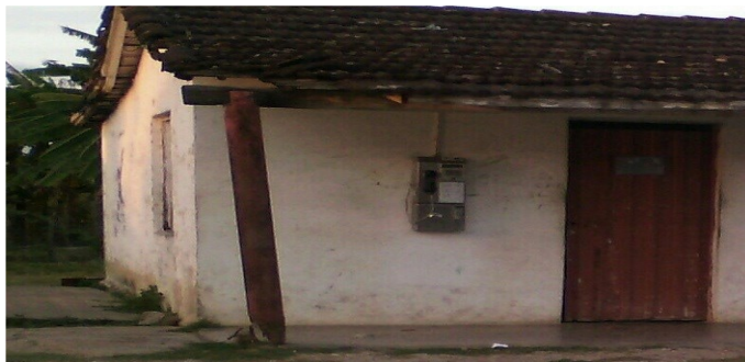
Teléfono ubicado en portal de la tienda

"Voy a llamar a un pariente a la vecina provincia de Ciego de Ávila y no puedo hacerlo, pues el teléfono no marca el cero, para aumentar mi disgusto, cuando me propongo recoger las monedas del equipo, inesperadamente recibo un electroshock". Palabras de una joven inconforme, entrevistada por esta reportera.