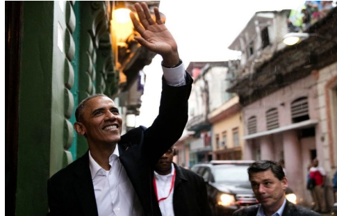
Obama saluda a habitantes de la Habana Vieja

No todo el mundo está de acuerdo conmigo en esto. No todo el mundo está de acuerdo con el pueblo estadounidense acerca de esto. Pero yo creo que los Derechos Humanos son universales [aplausos]. Creo que son los derechos del pueblo estadounidense, del pueblo de Cuba, y de las personas en todo el mundo.