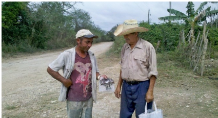
Un clientes que alcanzó resistencia

Todo fue dado porque la empresa de servicios de comercio interior no calculó la cifra real que debía llevar a dicha comunidad, pues conocien-