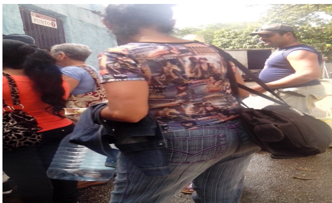
Clientes a la espera de productos cárnicos

Marcados por esa impotencia que producen las cosas que parecen ilógicas y que no son fáciles de entender, los clientes esperan varias horas en el recinto feriado, con la esperanza de que arriben los productos del cárnico, teniendo que abandonar el lugar sin la mercancía, al comunicárseles que no existe transporte para los productos debido a razones que solo la base de transporte provincial conoce. Algunos trabajadores del lugar, ante la prolongada situación optaron por buscar medios de transportación por cuenta propia para traer los productos y según opiniones de algunos de ellos fueron censurados y amonestados por las autoridades, algo ilógico y poco razonable, actitud que ha seguido dando de largo a un problema que afecta fundamentalmente al pueblo.