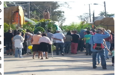
Procesión del santo patrón