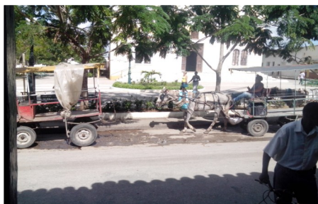
Orine de equinos esparcidos en la calle

Sancti Spíritus. Marcado por ese olor penetrante e insoportable producido por la orina animal, el parque de La Caridad de esta ciudad se ha convertido en un lugar poco agradable y riesgoso para el sano esparcimiento de sus habitantes.