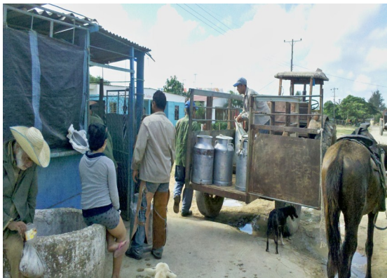
Punto de recogida de leche "El Patio"

Según campesinos de la localidad la empresa comercializadora de productos lácteos no se pone de acuerdo con la cooperativa para resolver el problema existente, ya que la primera acordó pagar el acarreo o traslado de los productos hasta una distancia de 10 km, pero en los últimos meses se ha negado, alegando que hubo irregularidades a la hora de establecer distancias; ya fueren por parte de la empresa o de las cooperativas, en no hacer un trabajo con rigor y seriedad.