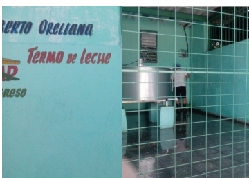
Punto de entrega de leche

Sancti Spiritus. en los productores individuales del Impacientes y a la espera de soluciones definitivas, campesinos espirituanos manifiestan inconformidad y malestar ante las continuas demoras e irregularidades en el pago de sus producciones de leche por parte de la empresa de productos lácteos Rio Zaza de esta cabecera provincial.