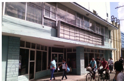
Tienda La Época lugar del suceso

Una mujer cuarentona ante tal abuso dijo de forma contundente: Yo no sé si ese muchacho tiene un paladar o no, pero lo importante es que pagó con su dinero un producto liberado, y agregó, sí ese fuera mi hijo yo no sé qué iba a pasar, pues yo no acepto que los que ponen estas leyes abusivas, y que además se crean dueños de todo y de todos, envíen a sus emisarios con dedo inquisidor a culpar a cualquier ciudadano emprendedor que busca mejoras económicas para él y los suyos.