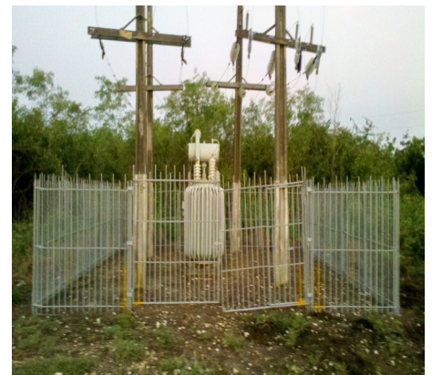
Subestación N°44 El Cieguito.