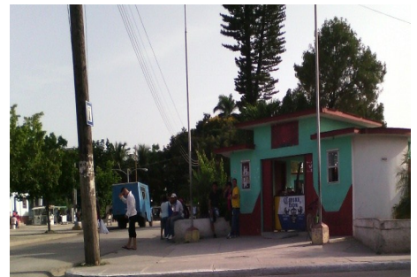
Círculo social "Hermanos Santo"

expensa del sacrificio de la gran mayoría y peor aún, si se trata de estudiantes, y del pueblo trabajador que es quien labora y produce y es el que menos se beneficia con esta nueva modalidad gastronómica. Pues sus recursos no alcanzan para tales precios.