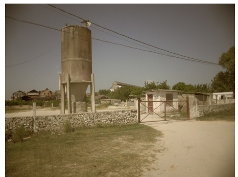
Local de venta de materiales

Según testimonio de otra persona afectada que en una ocasión necesitó comprar cemento, al no estar conforme con la medida con la cual le despacharon, protestó en voz alta, acto seguido el dependiente le sobrecargó 3 sacos y le dijo: "No me formes rollo aquí. Mira como está la cola".