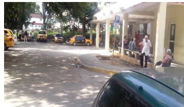
Piquera de taxis

La atribulada madre comentó a este reportero "Parece mentira que esto haya pasado, tres taxis y una ambulancia en el lugar, que en quince minutos daban la carrera y que hayamos tenido que pagar un transporte para trasladar a un niño en tal estado".