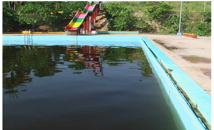
Cabañas abandonadas y Piscina con agua putrefacta y pestilente.