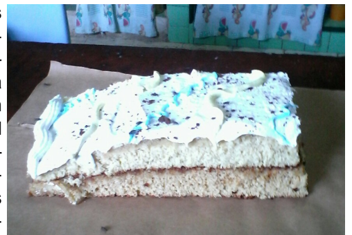
Panetela cubierta con merengue mas conocido como Tranca Bucho.

En próximas ediciones de la feria dulces y alimentos en general se miraran varias veces, los dulces es posible no salgan de las "vidrieras".