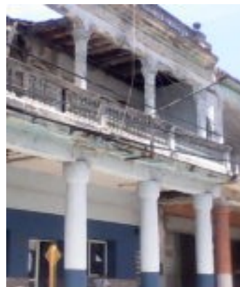
Correo de Güines.

Sin embargo han seguido acumulándose las solicitudes de atención dirigidas a los órganos gubernamentales del municipio, donde al parecer ronda la indiferencia.