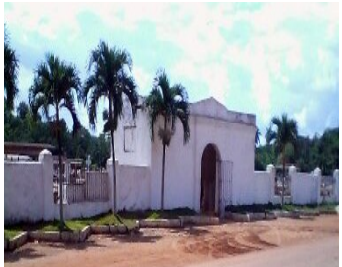
Cementerio del poblado de Aguacate.

La señora Cruz se encuentra en estos momentos bajo tratamiento psiquiátrico, provocado por el shock recibido al no encontrar los restos de su hija en el lugar que los atesora como última morada de descanso eterno. Las investigaciones hasta el momento solo han arrojado que los custodios y serenos de dicho cementerio, permanecen bajo el efecto de bebidas alcohólicas para poder pasar la noche en este lugar; siendo esta no más que una justificación que usan como pretexto para su ebriedad.