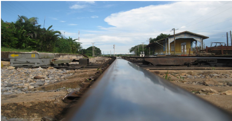
Estación de trenes del poblado de Aguacate.